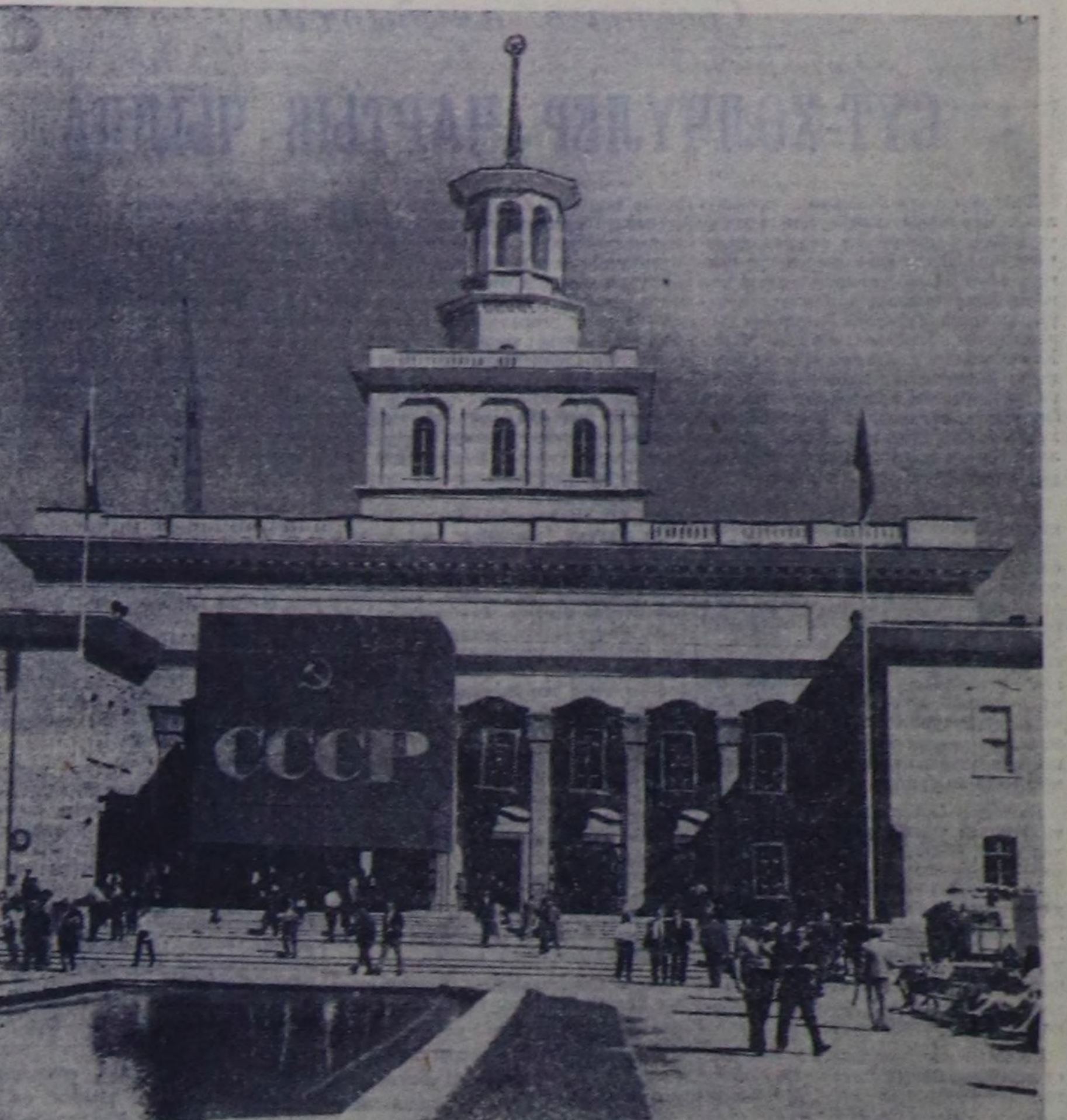
Бо чылдын сентябрь 24-тен октябрь 3-ке чедир Бурятия Республиканың Плавиде хоорайына делегейиниң XXIII шир. армарказы эртер. Анаа Совет Эвилели база киржир.