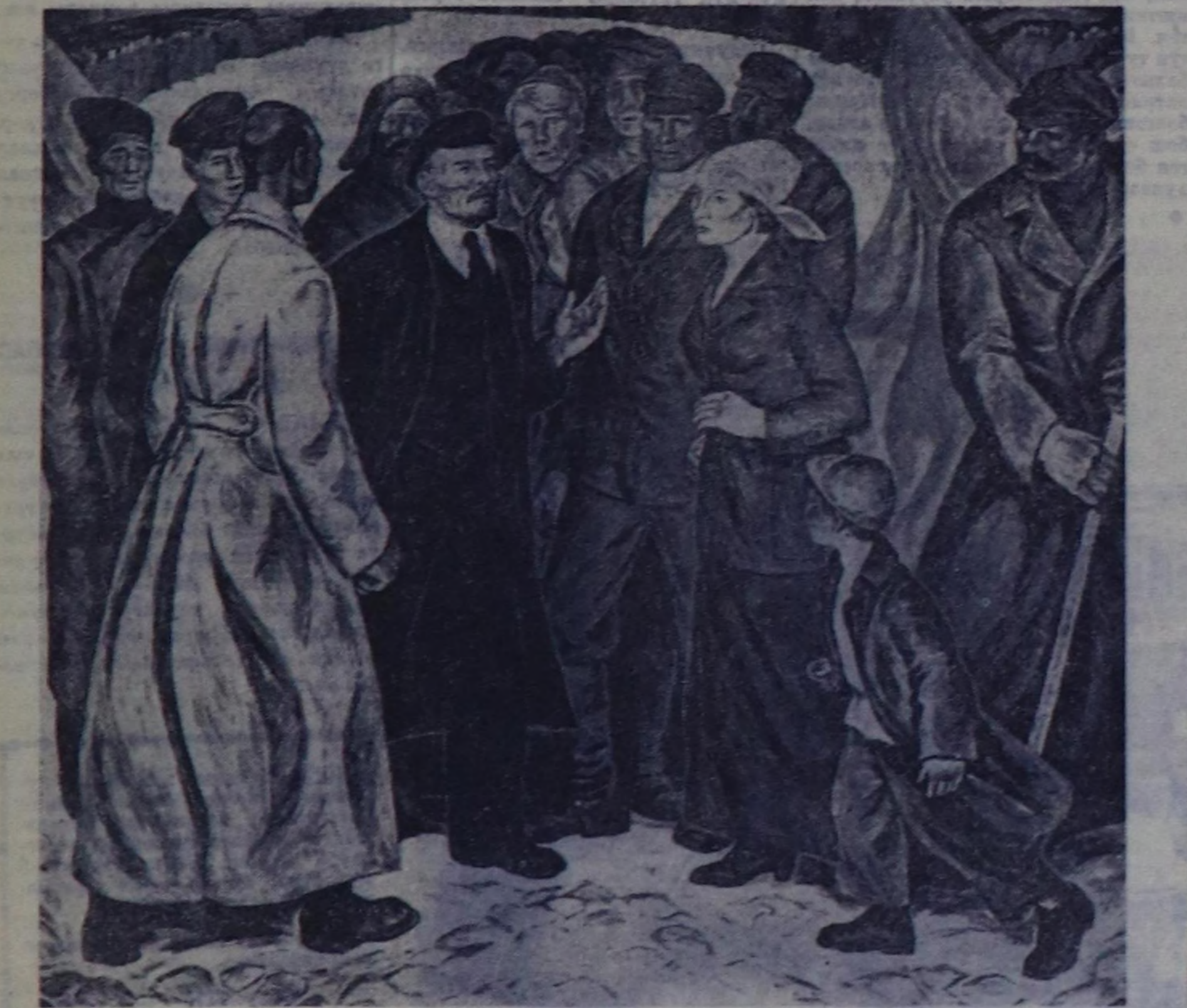
Москванын Топ делегате залында «Москванын чурукчулары — Октябрьның 50 чылынга» деп делегате аяктырган...