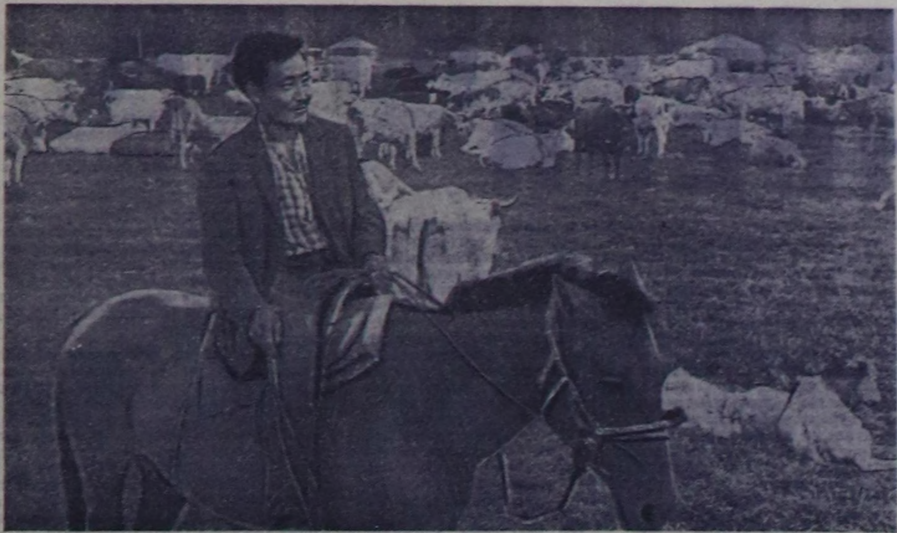
Тес-Хемь совхозун Шуурмакта бир дугаар сут-баран фермазы чартык чыдаа күүнүгө сут садырнын планын 119, суттү бүдүрүшүнүн планын 148 хуу күчүгөткөн. Фермада шууту 230 саар шек бар. Олардын деңизде семиртүүгө эки, Малдан хой продукцияны алмыр-биле чарба болуш толукмак жемерки база берип турар. Оон аңыда инекти дүнеки кададын база организастан.