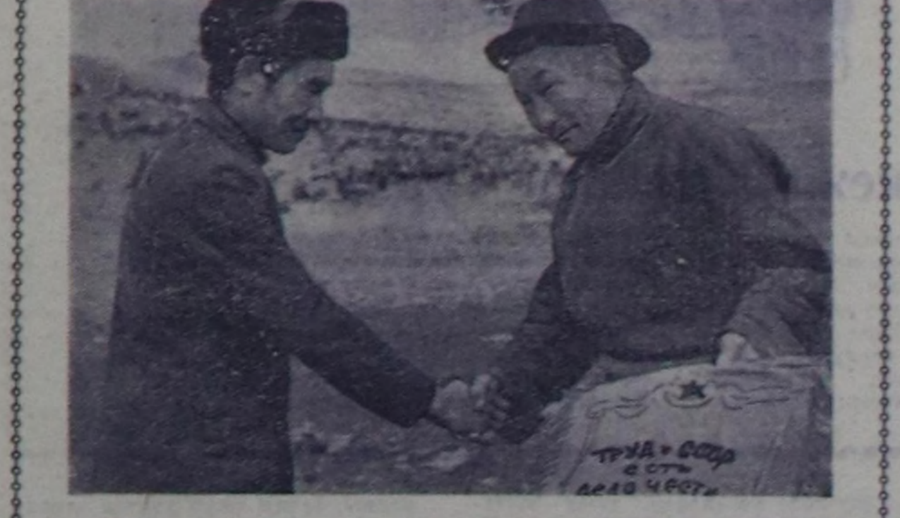
ССР-де күш-ажалы - аядарнын, эресе болгаш маадры...