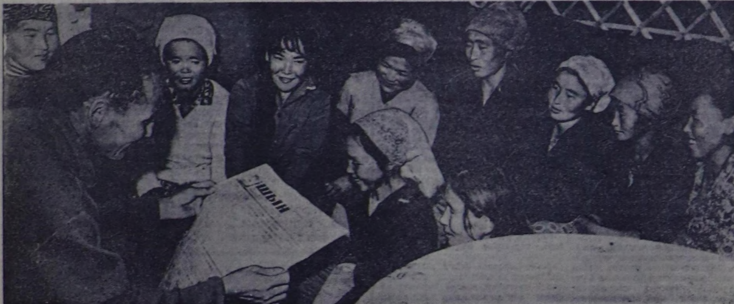
«Алч болуру куудан, кизи болуру чажында деп чонун үгөөр чыгаары бар. Илчине ленинчи комсомолдун соругаы — чаш кижилерни экижи кымын» каары, тодар-гайларга адылары төлөткөгө салгады кижилерин болурус, ол чүс дээр, коммунисттик амык тургузукчуларын дарган-каары-дир. Комсомолдун партиянын байланы дуулаачымы, кур жүжү болу болурус. Илчине Уаур Октябрын 50 чыла оо-биле толаштыр СЭКП ТК-нын Тезистеринде оон дуулаачымы «Советтер чуртуну амык сала-дым коммунисттик илчилерини шынч болурунун күрү-нү кижилерин партияга дуулап турар» деп бижээн.

Ам соруга бола, илчине мал ажылыга бугу талаан таарыкчалыг эки байддарын тургузур болурус. Бирн эвекте, илчине малды бажыг чедип-китиринер болган, малдык калжаларын, малчынларын турт-таар оран-суурин чорутур ой-шанда беле тургузур, өзге бугу күштү моонизир болурус. Эртен чылдык практикада четистерин бо чылдын илчине-нда катаптааы-биле бедик-китиринер мал чедирин камып, шын чарыгал турган, малдан амыр продуктузугу көздүрүп, оон шайларын экижерде соругалаар бистин мурунуста салдыган. Илчине бо бугу чуруга соруга-ларын чедип-китиринер күрүткө-ри Совет эрге-чагырганын 50 чылыга төлөткөгө белонус болурус. Я. ДАНЗЫРЫН, районун көдө ажал-агыл эргелегин кол зоотехник.