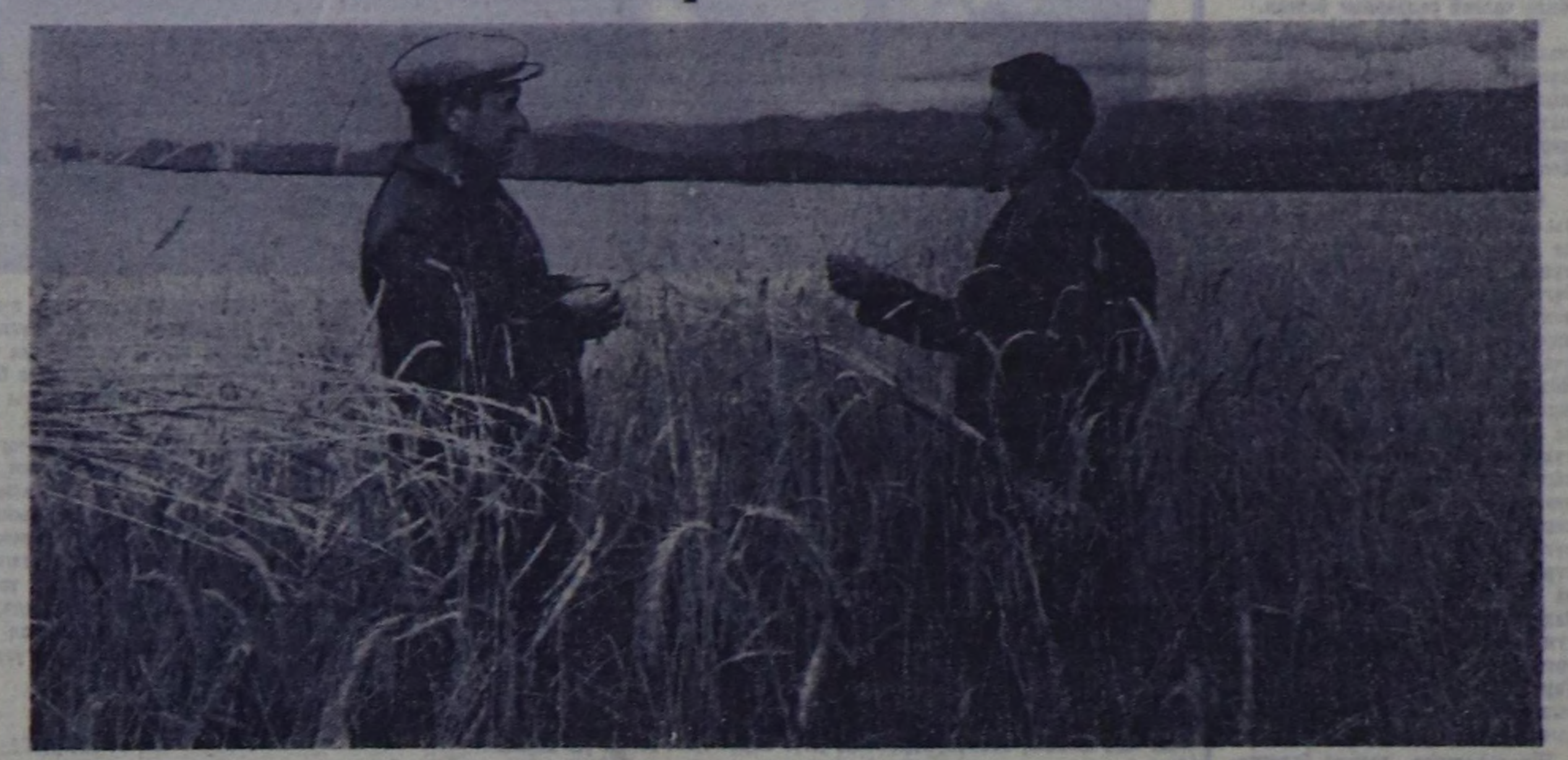
Улу-Хемниң калбак болгаш тараа шөлдери. Наймаар-ооа көөргө, тараа-ла, тараа — далай ышкыш чалым чыдар. Ам ол декиштерлерде чалай дүжүткүп башкымын быжып эгелээр, а чамдык културалар, ыкдыгы ыкыла-тас, оларган, он амыл хомо-ла ба-ла кезер апар. Кижж аразынч кире бээр көзүбейн баар бо чалай тараа — «Улу-Хем» совхозун № 3 салбырынч 3-ку брига-даның Хайыракан дамын амаалы обмачыштыг көк-тарааны дюр. Ол ач быжкан. Ынчангаш Улу-Хем районун таргачылары юбилейлик чылдын чак дүжүткүп ажаадымын баштайтынын моон эгелээр.

Бо түрүндө ол бригада мындыг чалай үнөм 400 гектар көк-тарааны ажарлар. Ынчаарга кол култура — кымыл-тасты ажаарымыч керериниң бетиңде тараа көрбөлдөрү — жамбайканың дайымы белеткелди бо көк-тарааны кезерде шөгөл көөр сорула-биле 30 койбайканы ажаар, амылчымыч керм ууда килер деп турар.