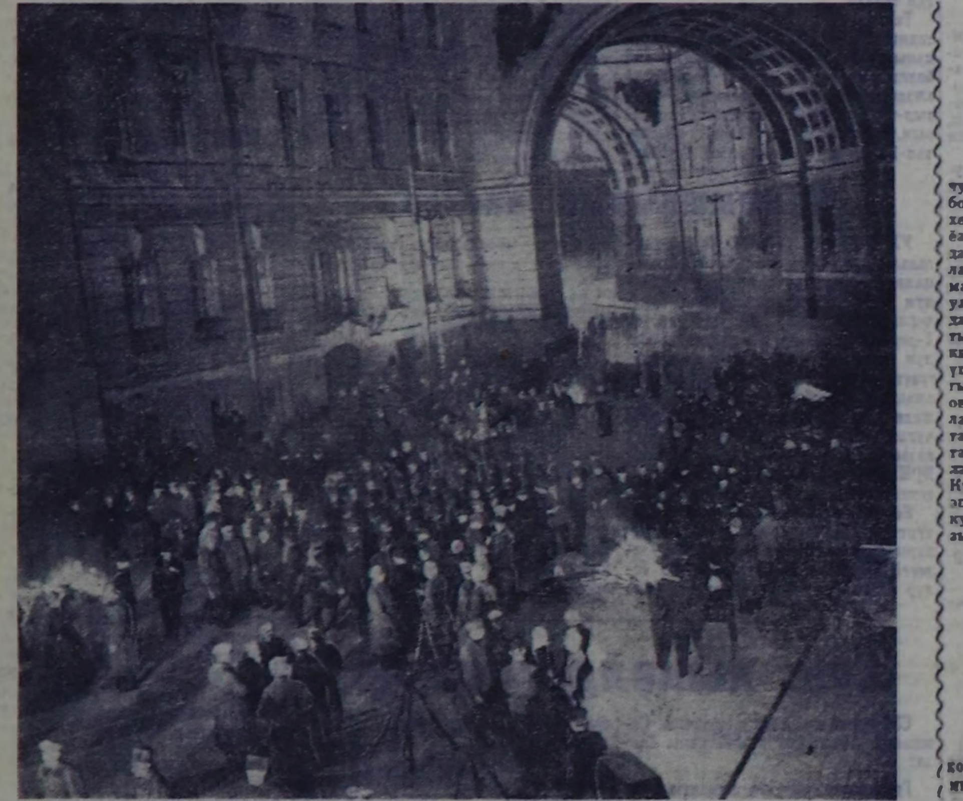
«Коргун чок чалымн чажында» деп төөгүлүт револютуг фильмин Москвадын М. Горький атыгы киностудияны Ленинградта турттырып турар. Ону 1917 чылдың болушкунуна турасаткан. Фильмин оон соодамаш автору И. ОТТЕН, кол режиссеру Н. АНИСКИЙ, оператор А. РЫБИН.

Оолактың болган оод удузган дайынчыларын тулчуушкун шөлүгө кургун чок, амылгы чорудуу дугайы Ромо атыгы 8-ки гвардейск атыгы шериг дивизионун командир гвардейск генерал-майор эрп Павлов 1944 чылдың февраль 17-де баа бижиреи ач, чээрби амыг чыдар эртеледе, баа салгып кералди. «Гвардейск удуз лейтенант Оолактын бирги кавалерий дайынчылары атакага кирешканда, 65 немеш солдаттарын болган офа-дерлерин удузган чок кылан. Эп Оолак бодурун кавалерий-биле камгалаар болган бичи-даа кургун чокка чаалаанка, бо тулчуушкунга ол боду 15 гвардейсктерин чок кыдыр удузган.