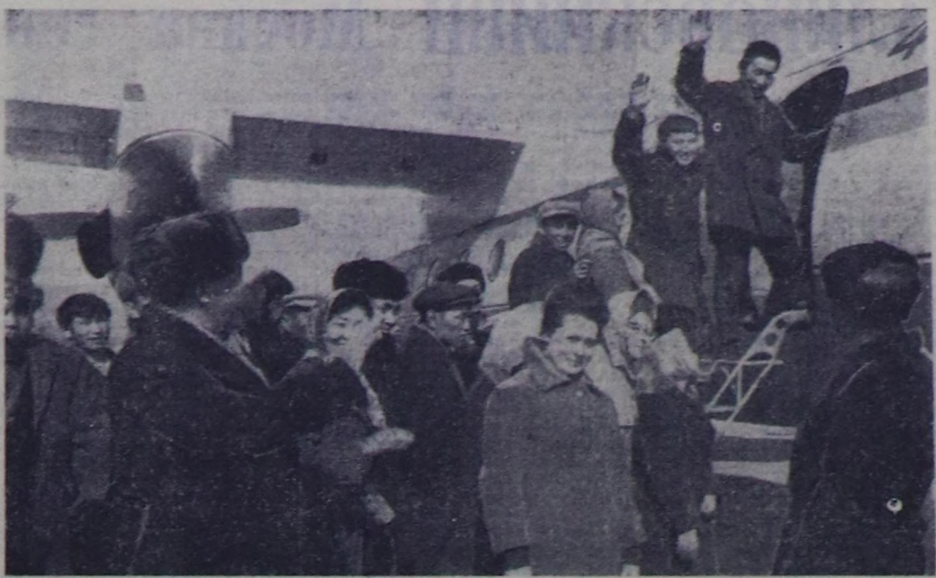
Болхота амгы үеде чазаглаашкыга белеткел амылдары чоруп турар. Бадарчы Самбынны Кужуруг-Ковуда чазанын калжааларын Кызыл-Даа суурун чурттакчылары шеф-белектерин чазагаларына үш хураган, ий хөй калжазын мал киниринге белек кылдыр септеп кылган. Шеф ажылын организастап тургаш, малчынарнын чазагаларына белеткелди чокку үеде доозарын суурун чурттакчылары шийтирелен. Чонун ол кудурулушкуну колхоз баштаар чери, партия организацияны, келээ Совет дегкен.

Совет эрге-чагырганын 50 чыл оюнга тураскааткан девискээр айы-биле көрүлдөге киржери-биле көрүлденн киржикчилеринин сөөлү бөлүү Кызылдың аэровокзалындан чоруп турда, бо чорукту бистик фото-корреспондентис С. Феодистов тырттырган.