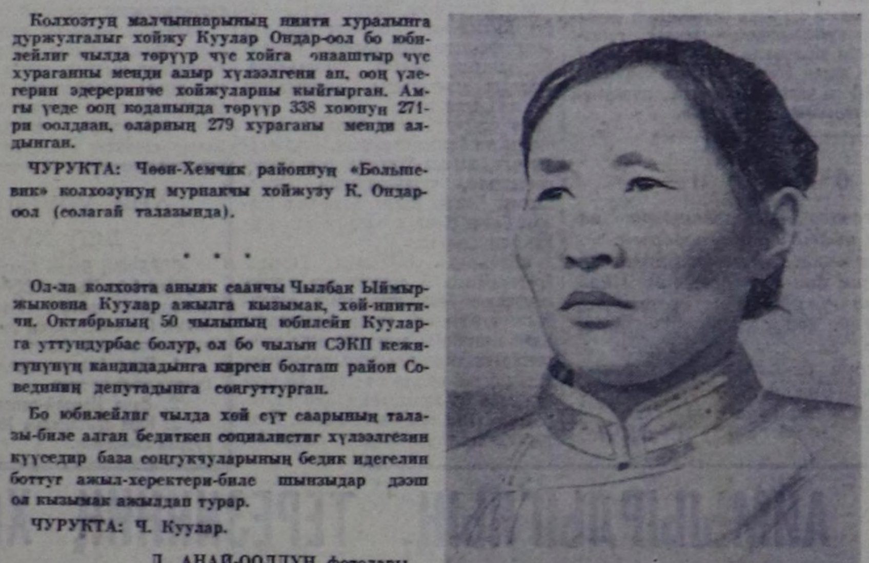
Ола-ла чокузта анык саанчы Чылаб Бимр-жикова Куулар амыл кызык, хой-инти-чи, Октябрын 50 чымын билейн Куулар-га утундубас болур, ол бо чымын СЭКП кезе-гитунүч кандалады көргөн болган район Со-ветини депутаттыга сөгүттүргөн.