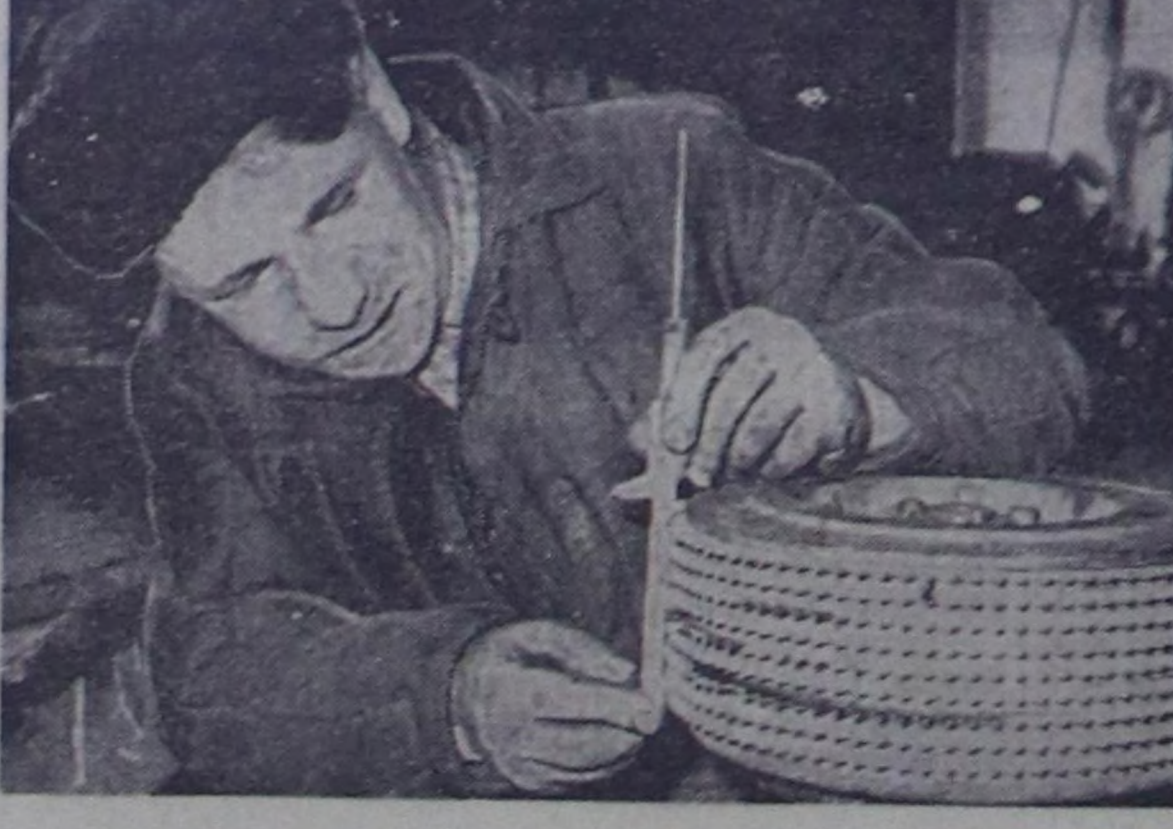
Таңды районнуң дуржулга станциясы.