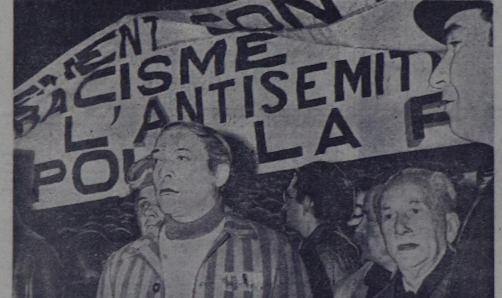
Барын-герман нацизминик катал төртүнүң турарына удурланышыкнын улуг чыскалы Париже болуп эрткен. Муң-мук кижилер нацизминик катал төртүнүң турарына боттарынын илензешиниң илергейлээн. Барын-герман национал-демократтык партия-

ПАРИЖ. (СЭТА). Францияда хлебтиң өртөөнүң база катал улгаттырар дугайын чарлаан. Чижээ, Парижде чамдык сорттарын хлевиниң өртөө килограммын 11 хуу арттаан. Сөөлгү чылдарны дүргүзүндө хлеб өртөөн каш удаа улгаттырган. Ийн чылдың мурунда оон өртөөн 20 хуу бедиткен турган. Эрткен чылда хлеб өртөөн база улгаттырган.