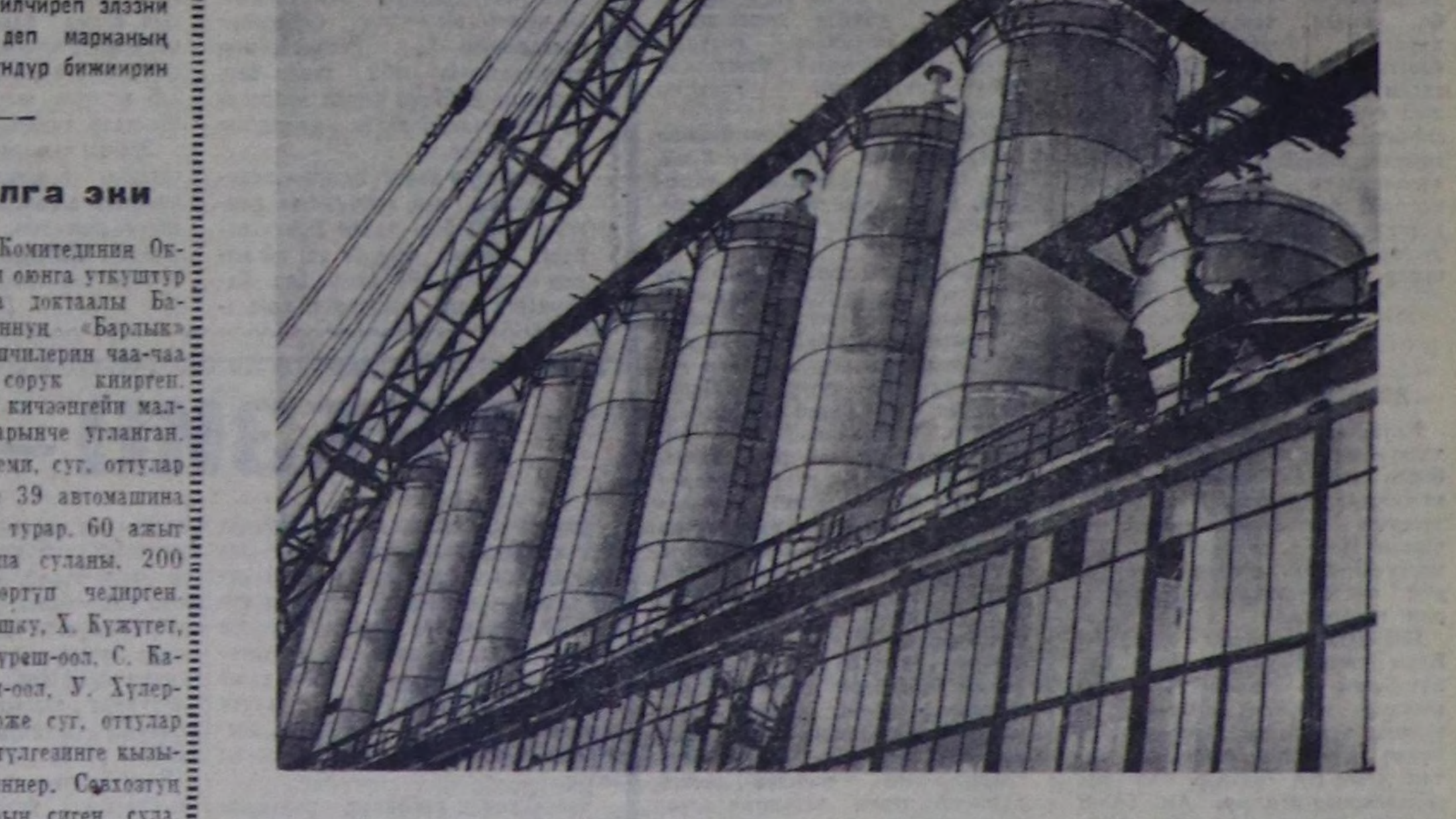
Татарың улуг химияның бүдүрүлгөс—Каааның организатиниң сиптег заводунуң күтүзү чыл келген күтүзү-ла адуң турар. Ам илде полигидроген бүдүрүлгөниң ийги ээлчөпчүлүгү турар.