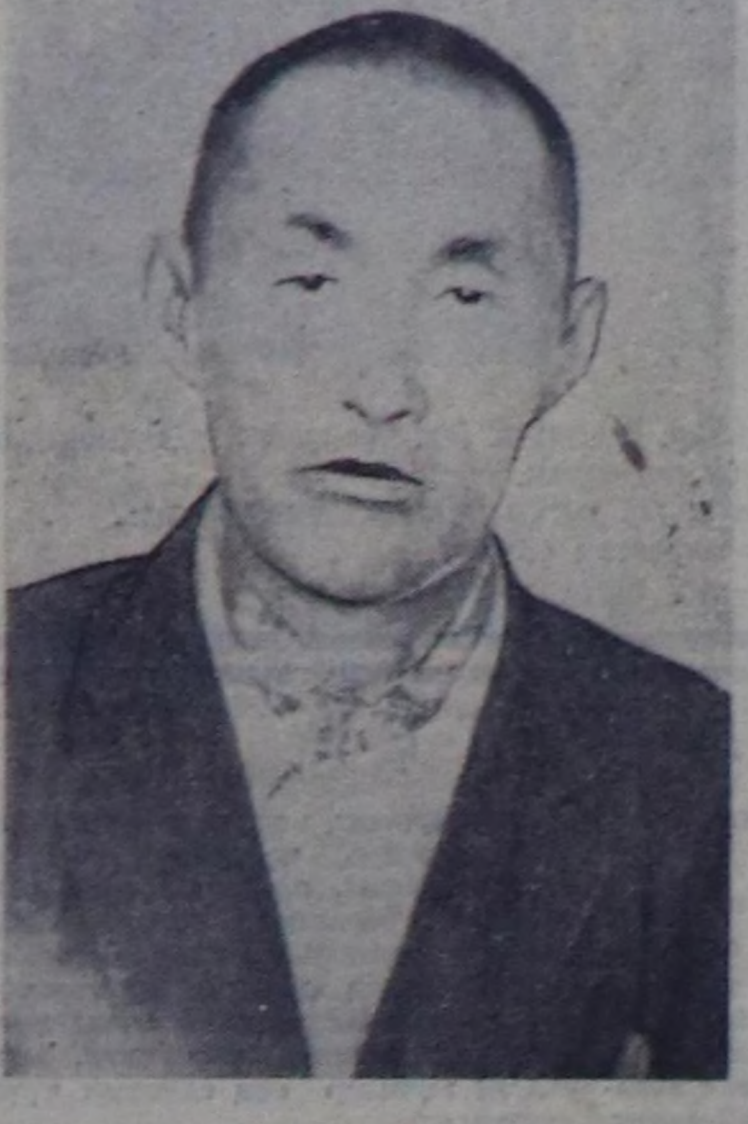
Тугун чаалап алган

Сонгулда кампаниязының чугула сорулгаларының бирээзи—чер-черге партия-политингит болгаш тайылбыр-массалыг ажилды калбартыры болур. Агитпунктулар болгаш агитколлективтер тодаргай план эзугаар, доктаамал амылдаар, агитаторлар сонгулданың Дүрүнүм, совет сонгулда системасы биле совет демократияның айтырыгларын, Коммунист партияның болгаш Совет чазатын политиказын, ибилейлиг чылда республиканың, район, колхоз, совхоз, ферма, бригада, бүдүрүлгө бурдунуң мурдунда салдыгын улуг сорулгалары аал-башын, ажилчы кижи бүрүзүңгө чедирип тайылбырлаар хүлээлгели. Ол сорулгалары күүсөдиринче бугу ажилчы чонну мобилизастарың чер-черде партия организациалары хандырган турар ужуруг.