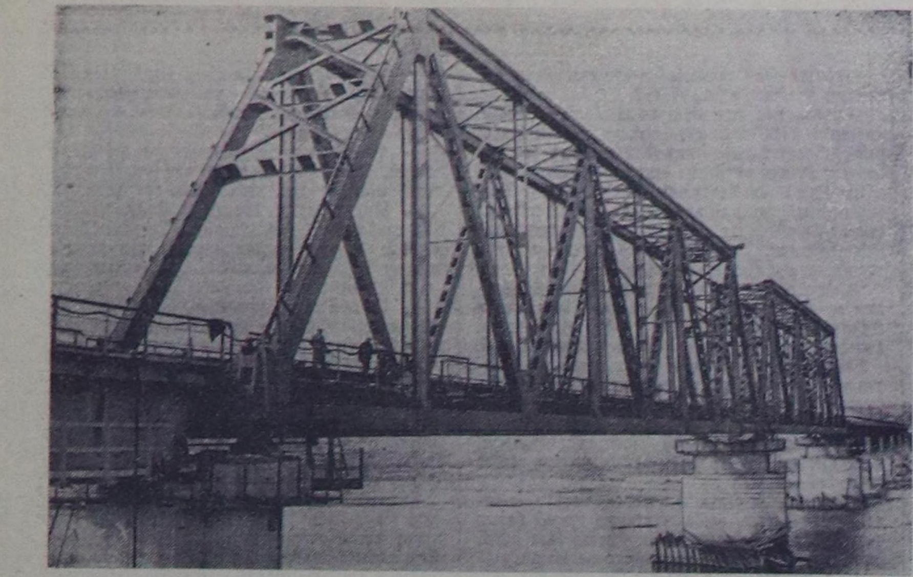
Подобасс—Артыштань 130 километр узун дурттуг маң оруун Новокузнецкиден (Кемерово область) ыраң эвез чөдө тудуу турар. Чаа демир орук Хансианың демир руда болгаш хөмүр даш-биле байлан райондарын Назх-стан болгаш Урал-биле харылзаштырар. Подобасс—Артышта демир орук кузбасс металлды, хөмүр