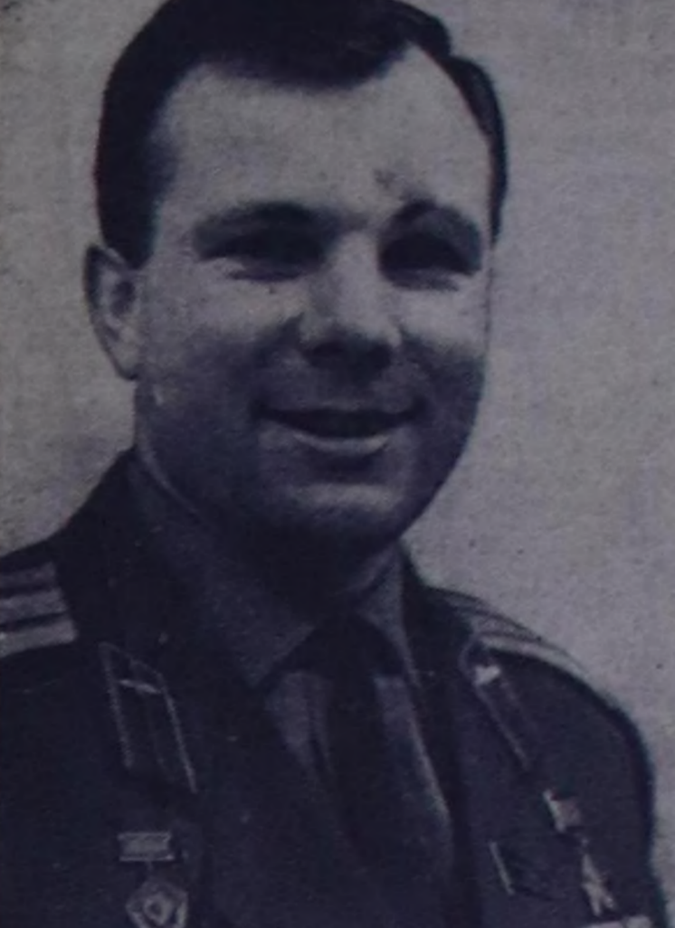
ССРЭ-ниң уждукчу-космонавт Юрий Алексеевич Гагарин чаа чыл-биле совет кижилерге байыр чедирип турар.

МАР-ның Улустуң Улуг хуралыңың Президиумунуң Даргазы, МАРП ТК-ның Политбюроунуң кежигүнү эш Ж. Самбу Совет Эвилелинде чоруп турар зайы-биле СЭКП ТК-ның Чыгыне секретары эш Л. И. Брежневке декбрь 30-де Сухэ-Батор орденни тыгаскан. Моол болгаш совет улустарың аразында аны-дуңма найыралды быжгылаарыңа, тайбыңың болгаш социализмниң дегрөөн быжгылаарыңа ачы-хавы-