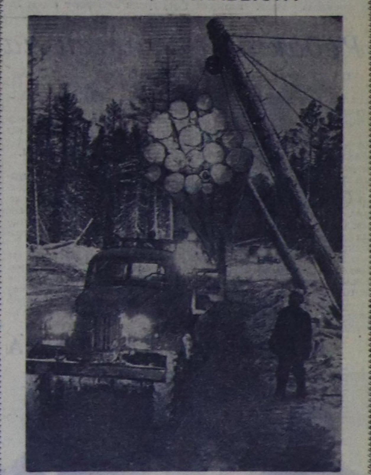
Ленанын оорууна 300 миллион кубометр хире үениг мөштөр бар болуп турар. Сибириниң улуг хеминиң мөш байлактарын шөгүдөп алары-биле Иркутск областа мөш белектерин «Ленале» деп чаа комбинация тургускан. Техниканы өйчө-не чаа чөлдөри-биле дериттинген, күчүлүг 13 будурагелер оң составында кийрип турар, оларнын каймык-даа чыда 200—220 муң кубометр мөштү белектер болур.

ЧУРУКТА: Каймоновтун мөш ажал-агында мөштөрүн дүңкө ээлчегде чүдүрү турары.