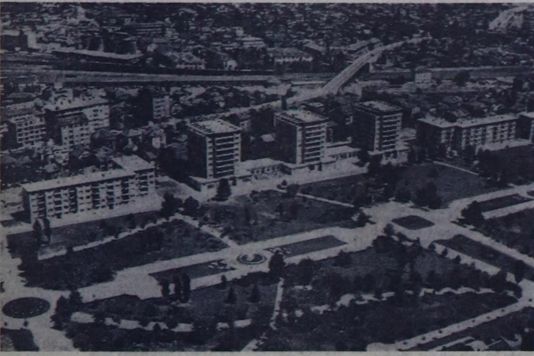
ЧУРУКТА: Болгарияның наймысгалы — София хоорай.