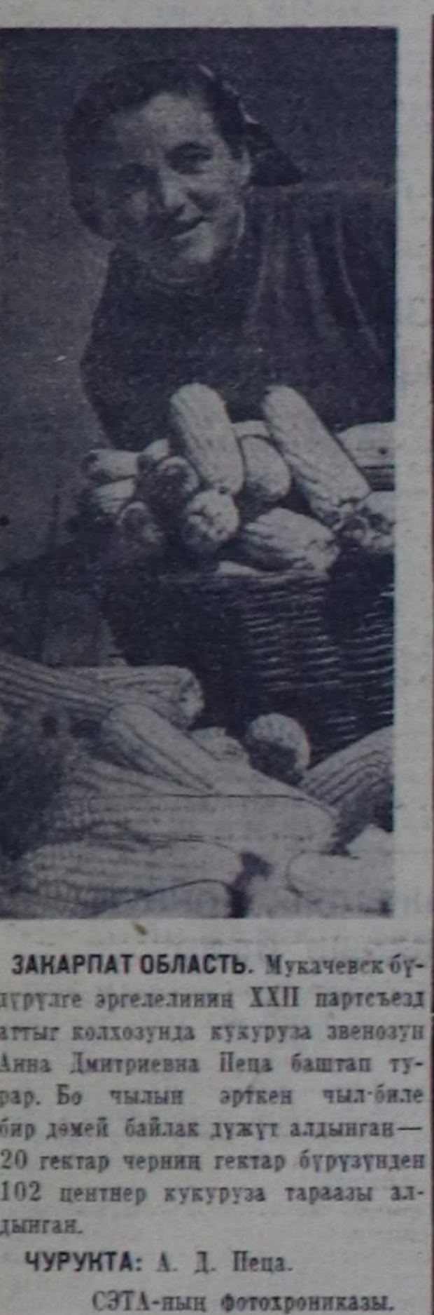
ЧУРУНГА: А. Д. ПЕНА. СЭТА-ның фотозоникасы.

Ол чемериин чамдыгынын шынары база багай. Чикеш, мал чир аражок карарып баксырап сизген, довракка борашкан капуста бургулери өккөн турар. Морковь болгон сүт шуут чок. Оон журундан кошкарларын хөй, эки үрө бээр артазы кудулуп турар. — Бо бүтүнү өй-шанда хандырып бээр болгон агаар-бойду-тук байдалы чыгып турар болза, ам артка ийн кодан хойну өк-табры 20-ге чедир бүтүн тарып боозадыр арга бар — деп, үрөлендиричи техник эш Тарма ба-дыткан турар. Хондей-Аксинда бот-оруга-чарыгалыг хойжу бригаданын кежигүнери шуштуу аяктын дөшт кызымак, ак-сеткилди, найбардык колхозчулар. Оларын моон соңгаар улам эки ажалда-рынга чогуур деткичче керек. «Кызыл тараачын» колхозтун баштаар чери-даа оон тускай артелинчилери, Эрбек участка-туну удурукчулары хойжу бригаданы организааст талазы-биле быжылган, оон практиктиг аяктыгы боттук дуалын көргүзүп, малчыларын ажалдыр-ла-чуртталганын докта-мал кичөөнгей салза чогуур. С. ЧАМЗЫН. (Бистин тускай көрү).