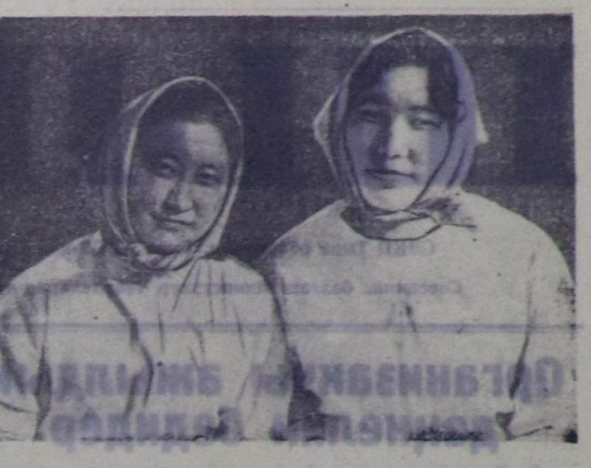
«Сүт-Хөл» сохозтун Ак-Дан сүт-баран фермазын коллективн хөй сүтү бүдүрер болгаш малдык продуктулуг чөдөр бөжөк дөш соруктуг амжылдап турар. Коллективте шупту комсомолдар, улуг коммунисттик күш-ажыл бригадалымыг бедик адми чөдөп амыр дөш шудуру демисей-жип турар.

Ленини национал политикаын чайгылаш чокка ботталдырылаан, тыва улусту Совет Эвизелинин му-накчы улустарын денделдө чөдөр көдүргөн. Бистин республиканын амды-агы чоннары оон азында бистин чуртуусуна коммунизмин тил-делте дөш совет улустун улуг те-мелесинге боттарынын тэлентиг са-лымышкын кыргер мынд байдал-дарын хандырын берген бистин тө-рөон Коммунисттик партиясыка бол-ган Совет чачыла артык амыг ү-рөзүн ханындан өөрүп четти-риникинин Совет Тыванын 19 чыл онда илергейеп турар бис.