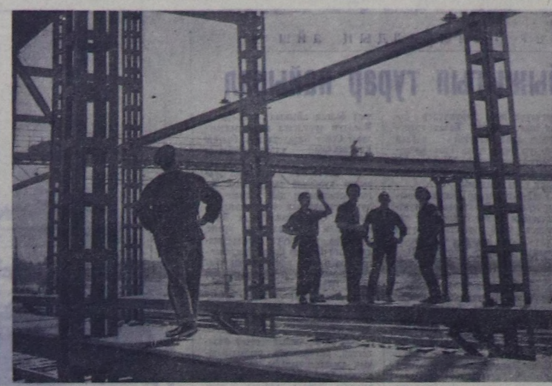
Таджикистаннын найысыла Душанбеде саржа-үс комбинатын дерип турар. Ол комбинат чыгыс хонукта 700 тонна хөвөч урезинерин болжазыраткаш, 140 тонна янзы-буру устерни бугуруп үндүрер. Амгы үеде бугурагелениң бири ээлчээм

Ф. ЖИТКОВ, салбырын баштар чериниң президиум кижигунер.