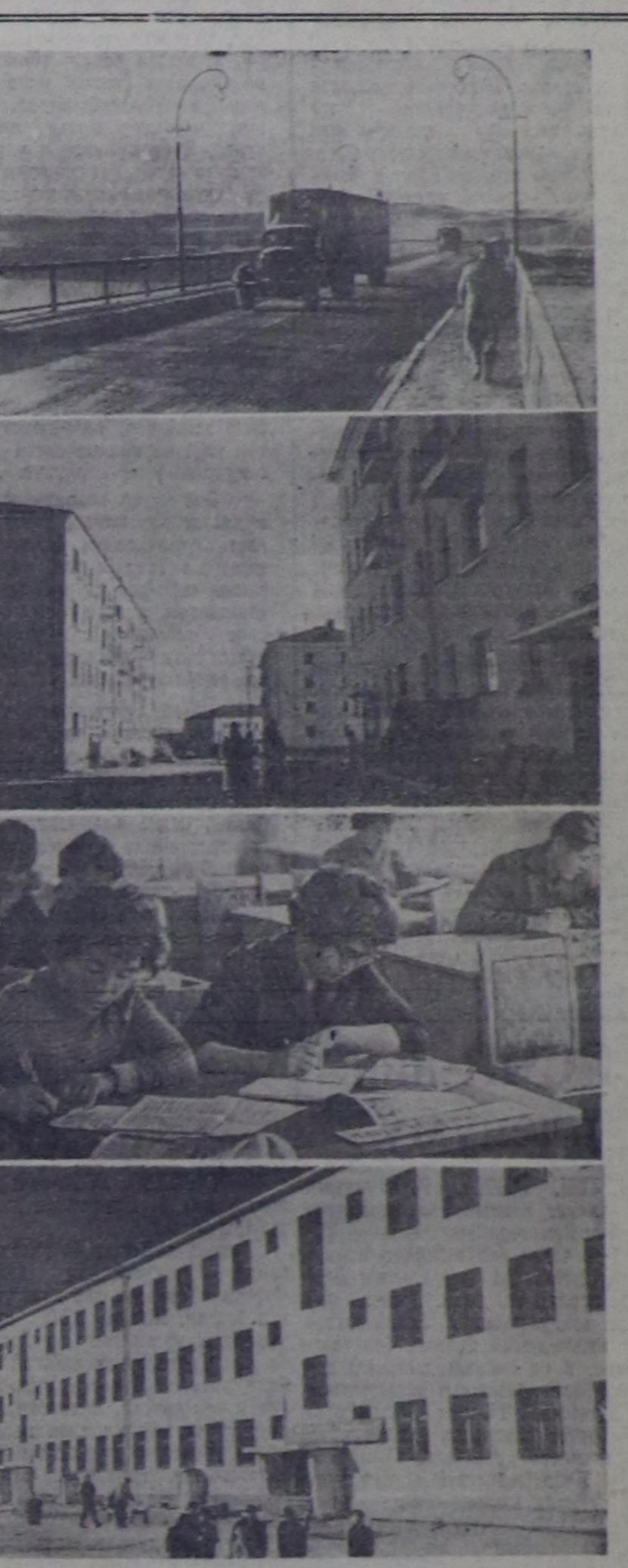
Кайгамчык улуг чалгын, чийг херел, каалама орус изекчилик, калгалайга ады алган, Улуг Октябрь, сеңээ совет кижилерниң күш-ажыкчы белектерин чеже дээр-рил... Оларын бистин кайгамчыктыг Төвөөн чуртувустуң бир булууну—Совет Тыва база-ла бараалатканын бөгүм сеңээ айтыкап тур. Октябрьга тыва чокнуң белек-сөгүнүн чандык дээр-жилери бө-дүр: Узбазы Улуг-Хемни, дүңмазы Хемикти келилдер чөдөдүпкан иши улуг көвүрүлүг болгаш бис... Аян-хевирин чарттыңып, дүрген саймырап олар. «Москвалык» Кызылдын көрдөөм. Оң № 26 кварталыга базыл-ла туруксаан кээр... Чаа, үш каът, хөлчөк чараш бажыңныг апарган студент оолаа, кыска адааргаар боор сен... Тываның хөй-хөй национал кадрларын белектээн—Кызылдың № 2 школазына барып көр. Оң өөреникчи, лери бо чылын үш каът чаа чурталаа бажыңныг булурлар.

О. СИН-ООЛ, республиканың дөгжүк-шии театрының режиссеру.