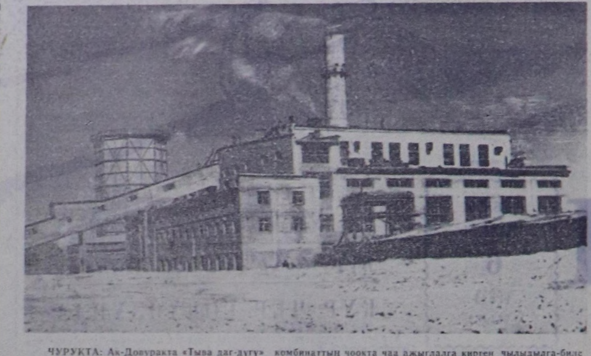
ЧУРУКТА: Ак-Довурак «Тыва даг-дугу» комбинаттың чоотка чаа ажыдаага кирген чылымдыга-биле аймаалар электростанциязы.

1961 чылдың октябрь 10-да Тыва автономнуу областы Тыва Автономнуу Совет Социалистик Республика кылдыр өзе тургудуу дугайында ССРЭ-нің Дээди Советинин Президиуму Чарам үндүргөн. Ычангаш совет республиканын найралдыг өргөбүдүнге Тыванын күрүне кылдыр хөгжүр чоругу хандыртылган.