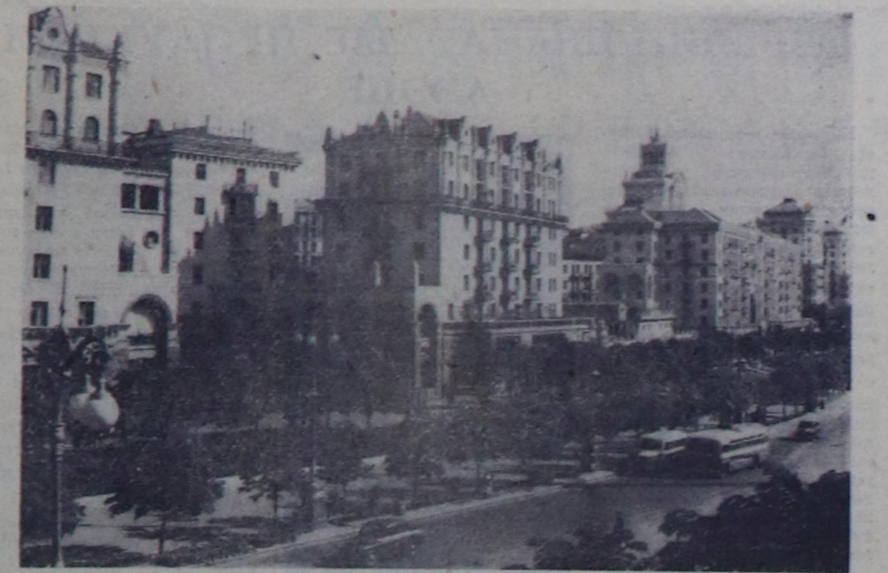
УКРАИН ССР. Киев—Крещатик төп орук.