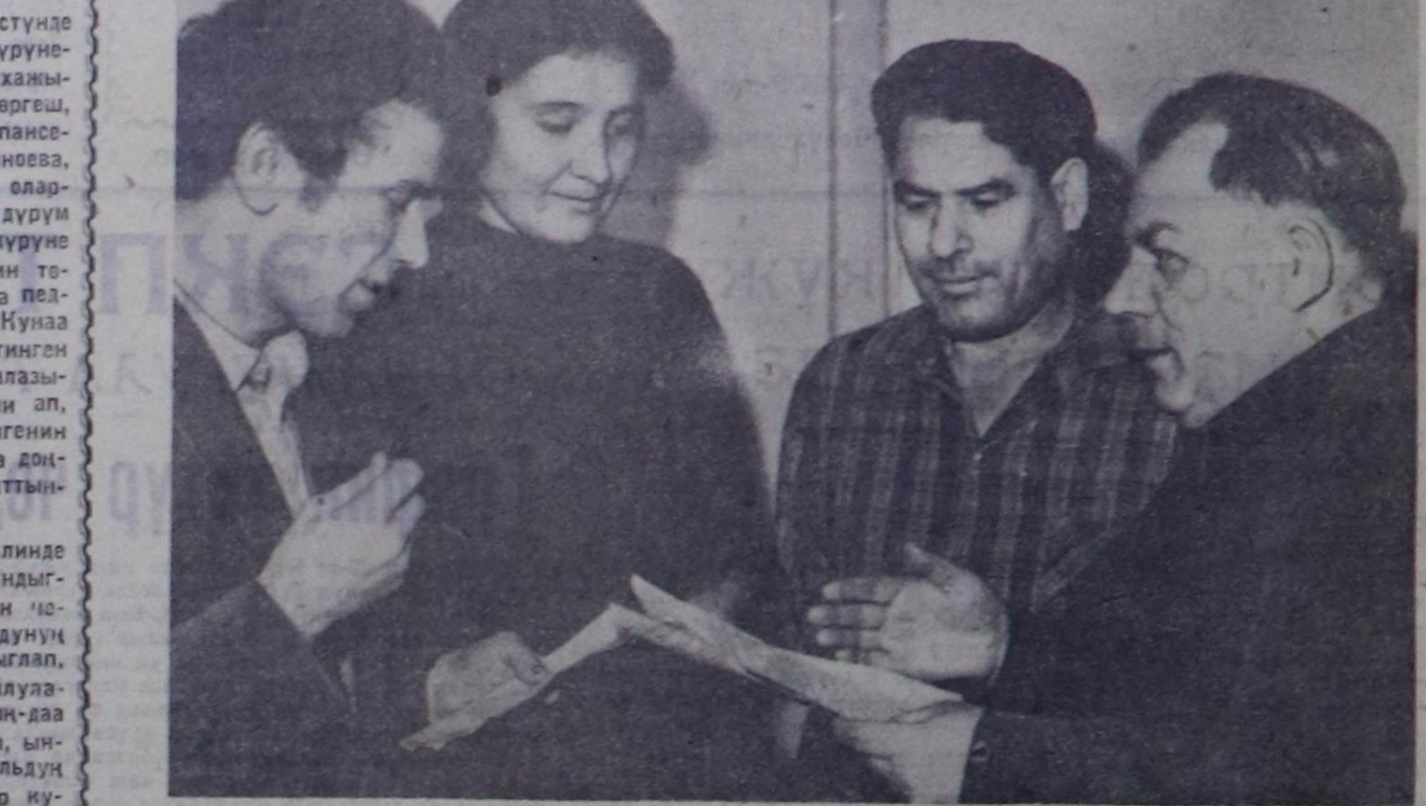
Партия-курүне контролунга дуужаалар хөй-хөй бөлүктөр Кызыл хоорайның бүүдүрүлгелеринде, туудуг болгаш транспорт организацияларында, албан

А. КЫЗЫЛ-ООЛ, Кызыл хоорайның партия-курүне контрол комитетиниң кежигүңү.