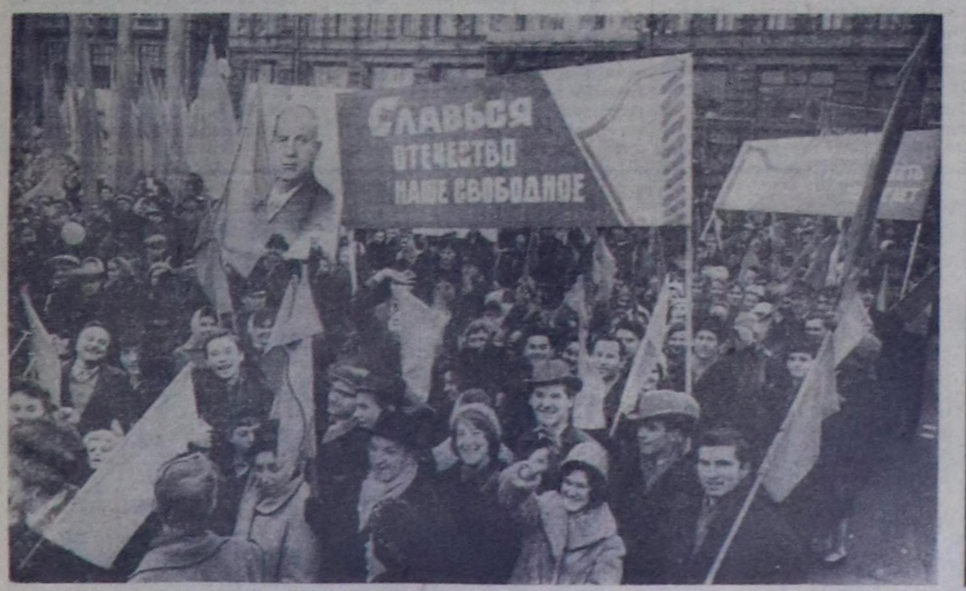
МОСКВА. 1963 чылдын ноябрь 7. Ажилчы чоннарың төлөктөкчилеринин. ЧУРУНГА: чыскаалганнарның колонназында.