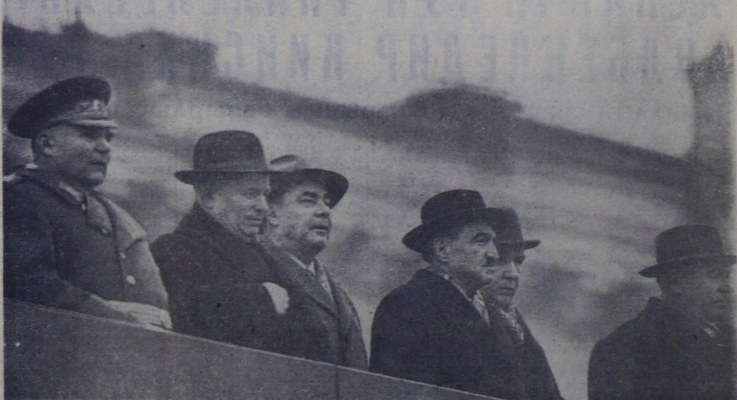
МОСКВА. 1963 чылдын ноябрь 7-де Мавзолейнин индиринде. Солагай талазындан: эштер Р. Я. Малиновский, Н. С. Хрущев, Л. И. Брежнев, А. И. Микоян, А. Н. Косыгин, Н. В. Подгорный.