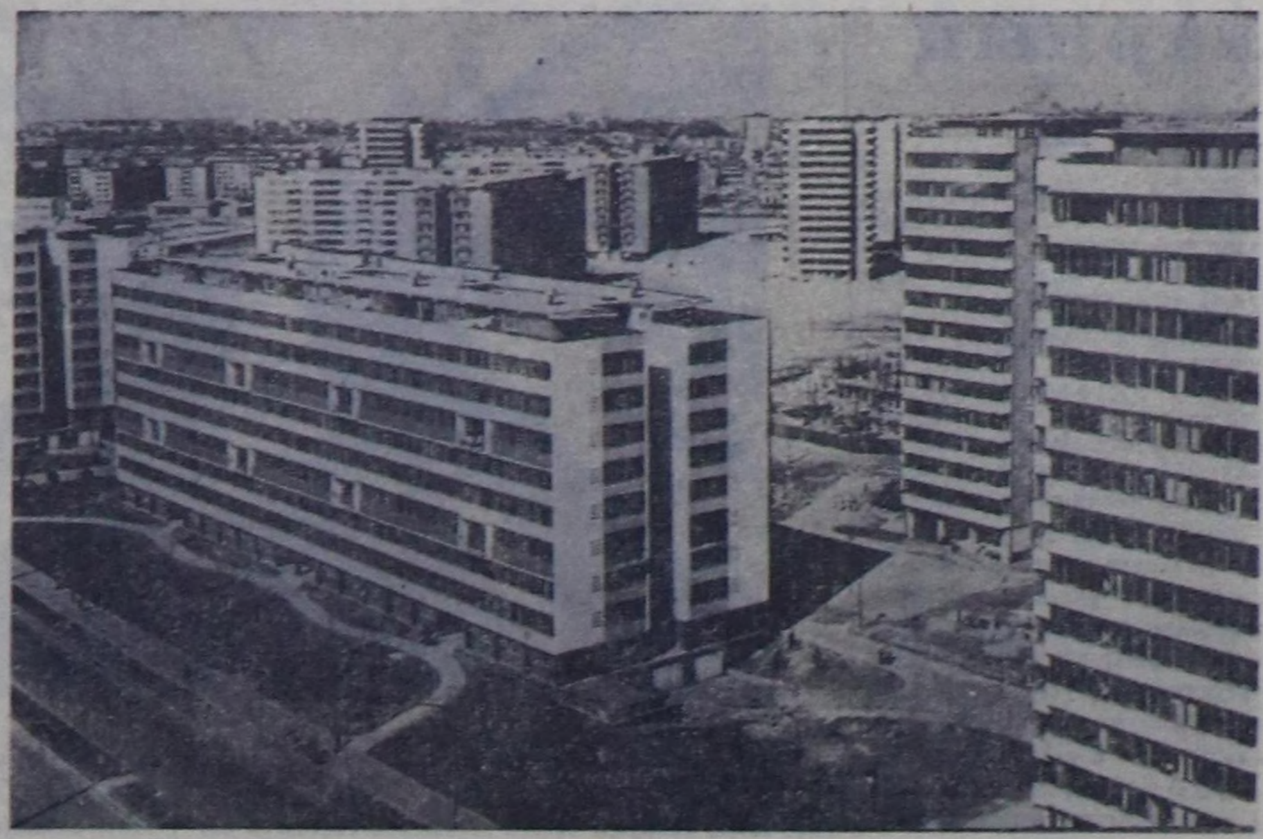
Белград — Югославияның Федеративтик Социалистик Республиказының эң улуг хорайы. Ында сөөлүк чыдардың дургузунда чаа үстүрү бадурүлгелери, өв-редилге черлери, театрлар, чуртталга бажыңнары туттунган. Найысылдаң амыг дөвискээни чорудат алынап бар чыдар. Ам Сава хемниң солагай талакы эринде «Нови Београдты» туудуп турар, анда 1965 чылда 250 муң киши чурттаар. ЧУРУНТА: «Нови Београд».