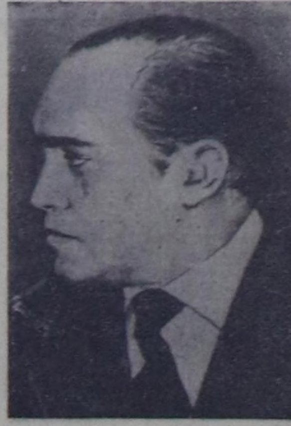
Оскар НИМЕЙЕР, хөй-ниити ажилдакчыны (Бразилия).

«Улустар аразынга тайбыңны быжыглаары дээш» делегейин Ленинчи шаңналдарының талазы-биле Комитеттин хуралы академик Д. В. Скобелынын даргалашыны-биле 1963 чылдың апрель 16 болган 17-де болуп эрткен.