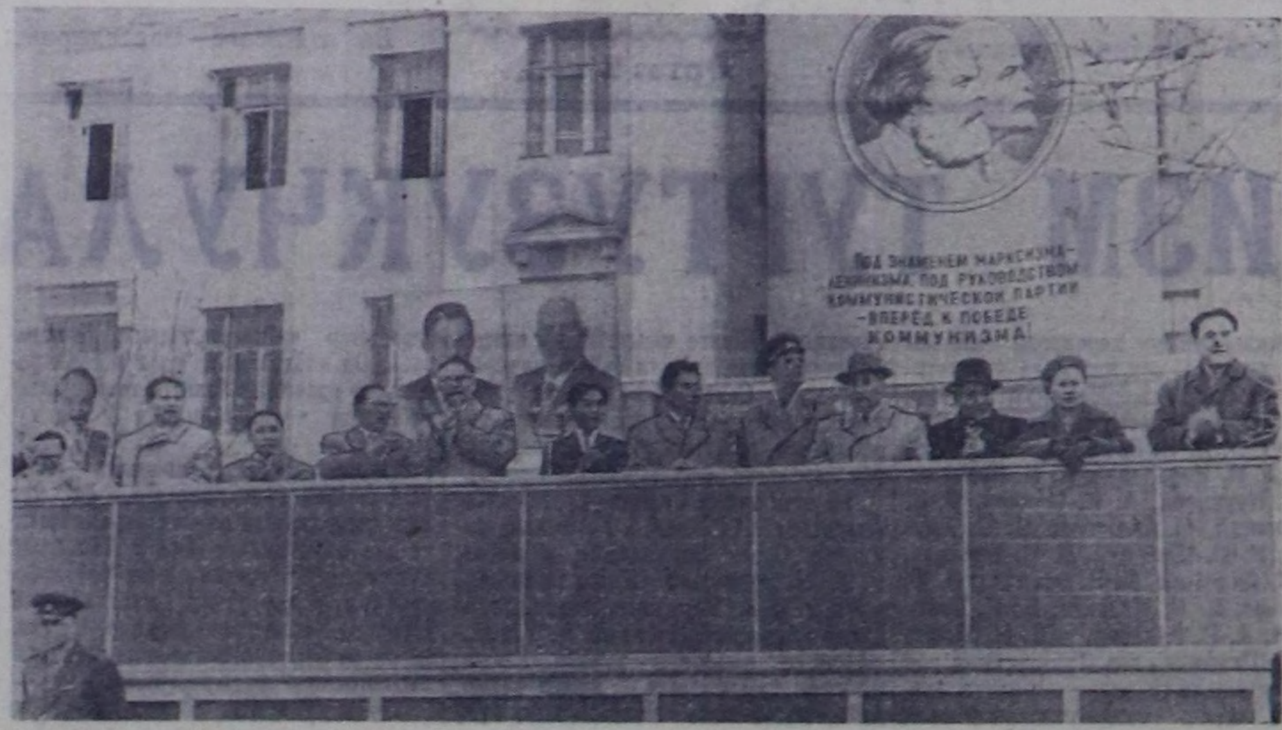
Чурукта: СЭКП обкомунун болгон ленин бажынын чанында илдирде.