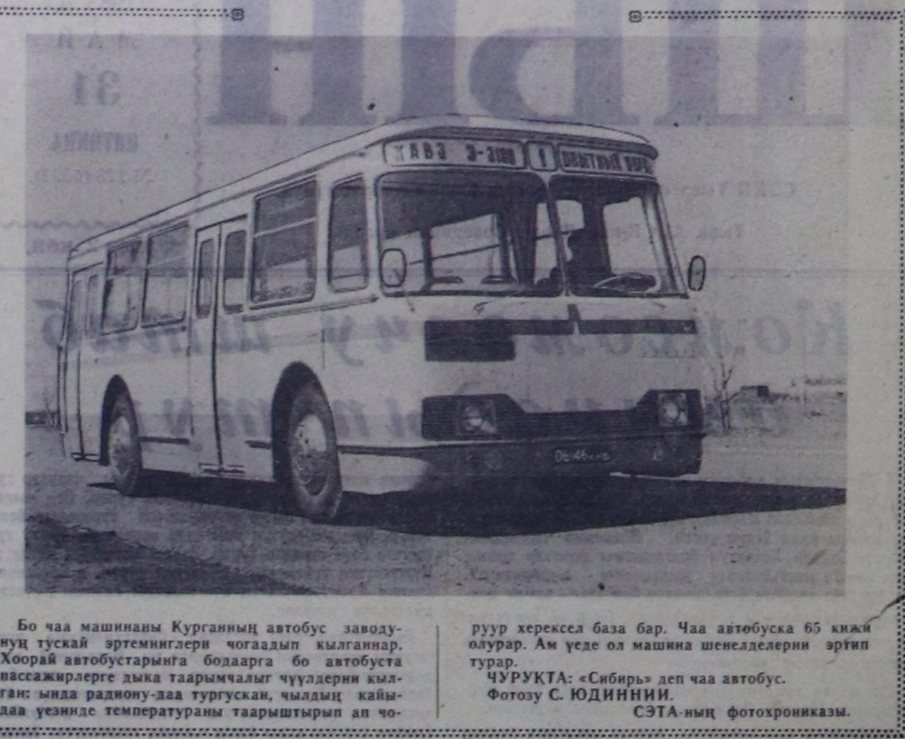
Бо чаа машинанын Курганниц автобус заводун тускай эртемчилер чөгөдөп кылганнар. Хоорай автобустарына болаарга бо автобуста пассажирларга дыка таарымчалык чүдүлери кылган: мында радио-даа тургускан, чылдын кайында уезинде температураны таарыштырып ап чоруур херексе база бар. Чаа автобуска 65 кижи оулар. Ам уесе ол машина шенделерин эртин турар. ЧУРУКТА: «Сибирь» деп чаа автобус.

П. САМОРОКОВ, Тыва АССР-нин култура министринин оралакчымы.