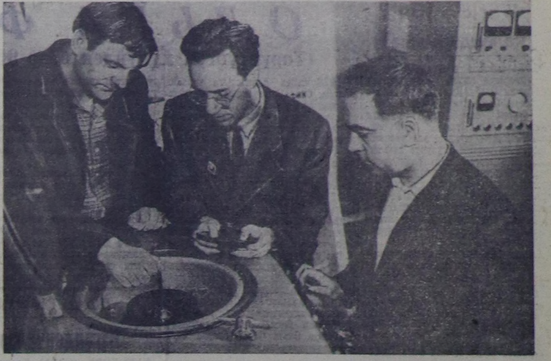
МОСКВА. Москва хоорай Совнархозунун биофизика аппарату-ра болгаш электроник машиналарын тускай конструктор бю-розу вешествоарык (белоктарын болгаш белок молекулауу кат-тыжымшыкыларын) ылгаар ап-параттары ажилдап кылып база белеткээрин чорууд турар. Цент-рифугтарын болгаш ультрацентри-фугтарын дыка хөй эртем-шынчи-лест институттарында, клиника-ларда болгаш химия лаборатория-ларында ажилдап турар. Олар инсоталарын болур-чөгүрүү-биле шинчилээр, янзы-буру халдым-рыг аарыларын вирустары иле-рээр, янзы-буру полимерлерин болгаш өскө-лаа синтетик ма-териалдарын бүдүрүү шынчи-лээр арганы берип турар.

олдун ыаш согааш-биле нүүсөдир жонглөрү күш-түг адыш чакнашкыны-биле уткан номеринин бирозин болган». Ол өтчөт-биле нады В. Б. Оскал-олдун надыр тавактар, тырынылар-биле нөргүзүүнүн фото-чу-руун парлааш, оң аздаанда мында чед бижэн: «Совет артист В. Б. Оскал-олдун өйназан жон-глөрүн көрүчүлөр улуг-биле үнелээш». МАР-ның улустун артизи Ж. Данзан «Бот-бот-тарындан өренер» деп чүүлду бижсэн. Оң ол чүүлүндө база тыва артистеринин нөргүзүүнүн онза-лал демделеп турар. Оң бижээни: «Совет Тыва-ның циркчилеринин өн-нөргүзүү болза нацио-нал уран чүүлүгү социалистик өзү-биле хөгжөш, улуг чедишкенин билеп турарын илердеп турар. Оларнын чинге демир кырлап өйнаары он-за эки болуп турар». Социалистик улустарын цирк артистеринин каттышкан нөргүзүү Улан-Баторга июнның би-ри чартыгында чедр үргүлчүлээр. «Аны-дунма чурттарын артистери уран-нөргөн арга-дурмулганын солумуп, оларнын нөргү-зүү бистин циркчилеринисе улуг дузалачмы бо-луп турар» — деп, «Унз» солун түнелинде би-жил турар.