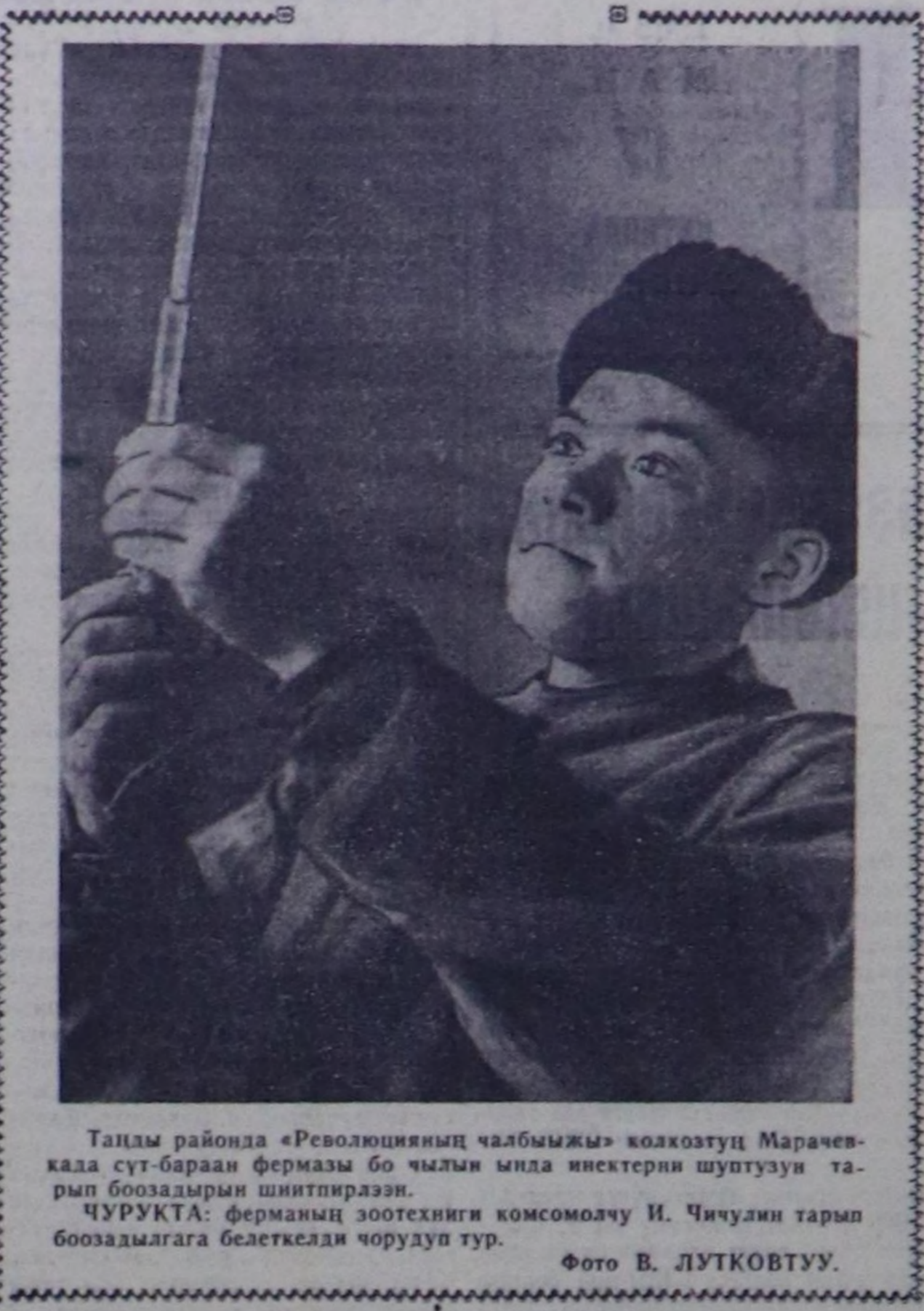
Танды районда «Революциянын чалбымжы» колхозтук Марчен- каа сүт-бараан фермасын бо чылдын мала инектерин шиптузун та- ры бооздырын шиптирээш.

центнерден эвээш эвес ногаан мас- саны өстүрүп азыр деп шиптир- лээш, черин бедиктеп алган. Малдын чайгы семиртилгезин эжиждерин салбырда планнаан. Бо- да-даа, шээр-даа малды тргүчү олар солуп, көжүп чоруп олардыр арганы эки ажылаарын, тускай семиртилгезе малды болгаш саар инектерин дүн, хүн чокка оларды- рын малчынар дугуржуп алган. Малдын келир кыштагалдым- кынынга баш бурунгаар бедиктеде- рин чорударын салбыр аман аге- лээр. Малдын бүрүзү кыштагал- ында каяларын шиптир алган. Ары- лаар, септелгезин кылар болгаш дезинфекциян ийи-ийи удаа чо- рулар. Салбыр 22 муң тоннадан эвээш эвес мал чеки бедиктеэр. Оңо шип- тинде 700 гектар кукурузанын та- рааш, га бүрүздөн 320 центнер- ден эвээш эвес ногаан массаны ся- лостан алыр. Бо чылдын салбырын малчына- рынга чуртталганын 8 бажынарын, хой, инек тарыыр пунтуларын, хой кыгыры залды, хой чуур черин кылар. Социалистик чарыкка алган хү- лөзгелерин күзүсидеи дээш ажал-ип ам чоруп турар. Салбыр- нын нияти хүлөзгелерин күзүсидеи тус-тус киялдерин эки ажал- даарын шиптир чумааржыр. Ичян- ган бригадалар, фермалар болгаш малчынар, тараажалар аразында чарык калаарын, а бирги салбыр Бай-Тал салбырын социалистик ча- рыкка кыйгырган. Н. НАЙДЫН, салбыр эргелекчиси.