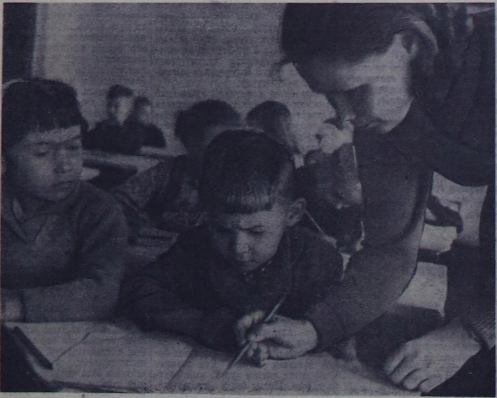
Олар чүгө алды харыглар, иччала-даа шко-лаже чоруп турарлар. 37 бичи чаштар хүнүндө делтем, чыркы класска чыгып кээрге кичээл эгелээр. Бичи школачылар туруп могоазым дээш 25-25 минута иштинде ийн уроку эртти-рер.

Забайкальниц Букача суурунда ортумак школада белетке клазын иччаар организа-таан. Бичи чаштар санап, бижип, чуруп, пластелин аям-буру дүрүзөр кылып, күш-куу-тура-биле кичээлдөп, язы-буру ырлары өөрө-нүп турарлар. Кысказы-биле чугалаарга олар-ның өөредилгези ажыкты чүдөр-биле холбош-