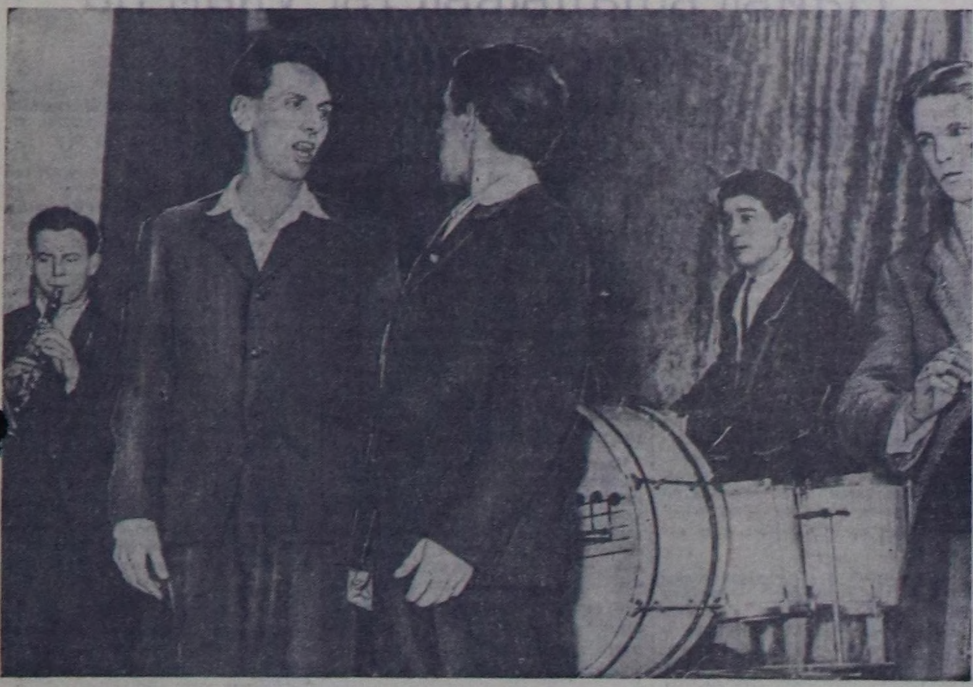
Хүндийн пассажирлер АТК-ын коллектив агитат-массалыг амьдрал эхи чорудул турар. Ол бүдүрүлдөг тусай агитбригада ажилда турар. Бригада нын келигунири чүгө хоорай организацияларын эвес, харын колдээн амыл-ишчилерин күзэлдиг