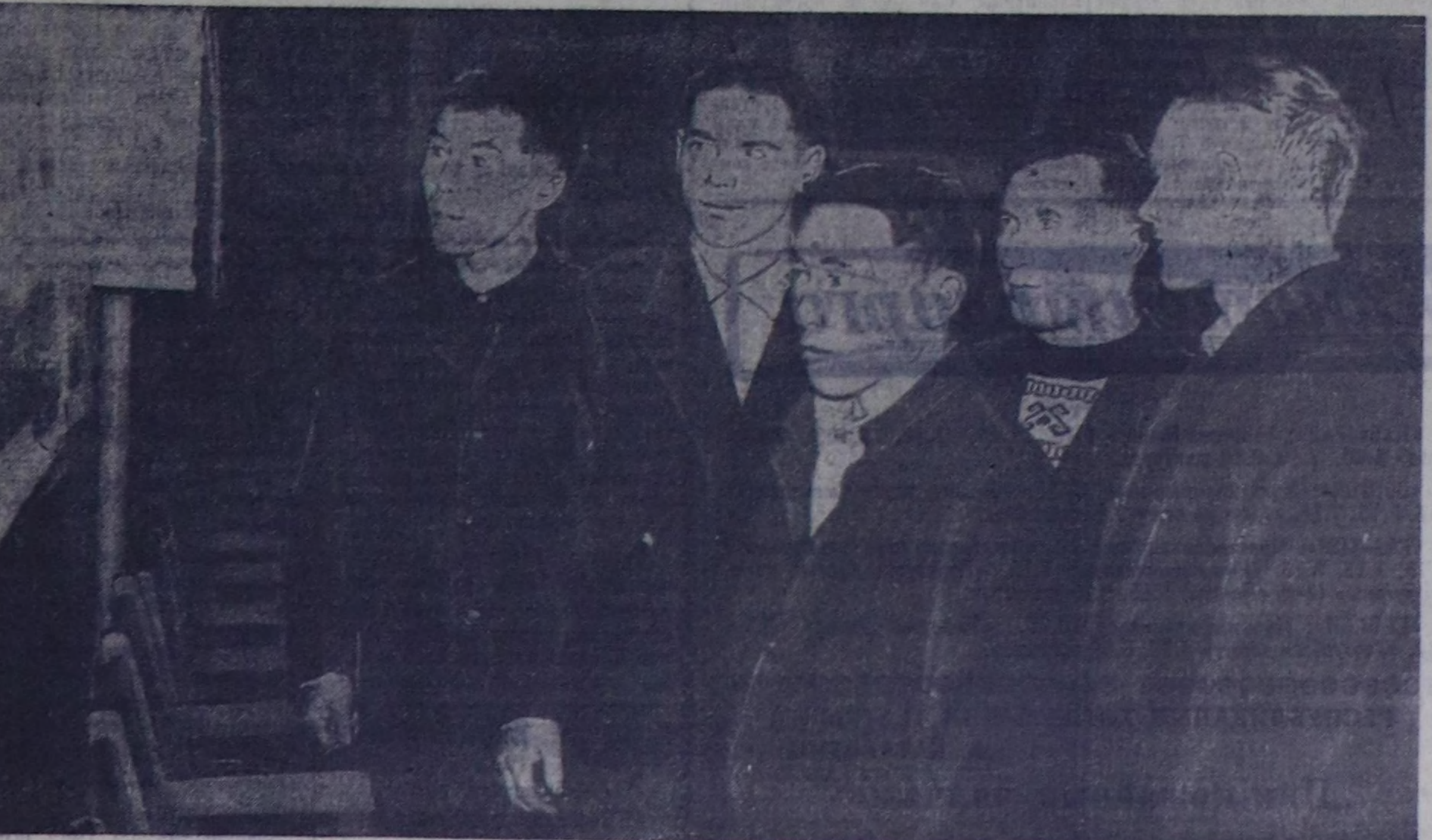
Республиканын сүт ашыл-агый ашылдаачыларынын човула хуралы чокта чаа Кызыл болуп эркен. Ол човула хуралга 1962 чылдын ашылдыңн түдөлгөдөрүн болгаш бо чылдын сорулгаларын дугайында айтырып чугаалашкан. Оң киржикчилери сүт ашыл-агый килдизинин, «Тыва сүт ашыл-агый тудуунун» өргөдөлинин тудуу-монтаж өргөдөлинин, суггарыга системанын өргөдөлинин ашылды шидыгы шүгүмчөсөп, хожудаашкынын уууктарынын болгаш сүт ашыл-агыйнын бүгү участка-

— Эрткен чылын менээ быжыг-лаан 552 гектар шөлгө кукуруза тарып, ону агротехниктиг негелдерлер өзүгээр илиртен, культувастап, органиктиг болгаш минералдыг чөмшөкчиделерин төп, кызымаккай ашылдаанын түнелеринде чүгээр түнелди чедип алган мен. Бир гектардан ортумаа-биле 390 центнер ногаан масса алдыган. Бо чылын бистин эвеносу 1.025 гектар шөлгө кукуруза тарып. Тарыга шөлгөне четир адгис күзүн белеткеттинген. Кукуруза тарып участкактары 5.000 тонна өдөк түктүнген, оң сөөртүлгөз ам-даа уругулап турар. Чеди кукуруза саялкаанын аддым септеттинген. Бо чылын эртен чылын куду өдөк дүжүтү аларын ширтирээр бис. Бодум хууда 200 гектар шөлдүн бир гектарыдан-на ортумаа-биле 450 центнер ногаан массаны өстүрү хуулаа алган мен деп оратор чугаалаан.