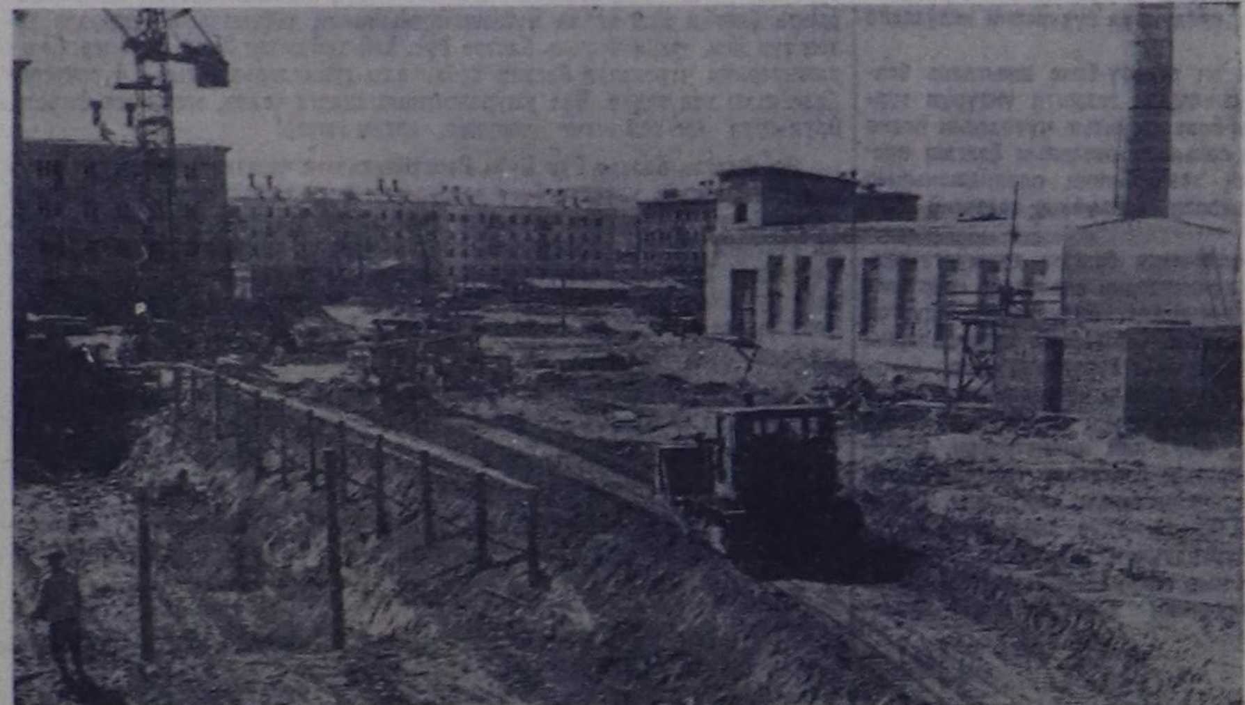
Бистин республиканын найысылалы Кызыл хоорайда чыл туудун на чач-ча хой кыт бажынарны чыс көвүлөп турар. Паром анында 26 кварталдын хой кыт чуртталга бажынары хоо-

Тес-Хем парткомун секретарынын оралакчысы.