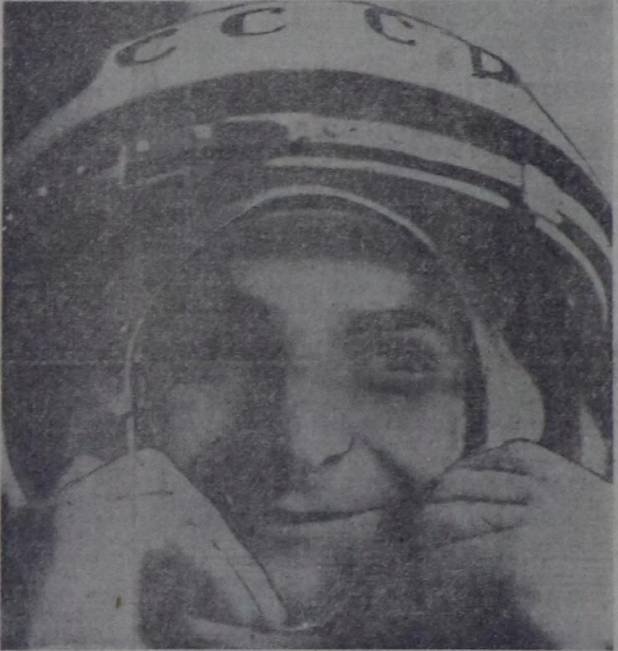
В. Ф. Быковский.