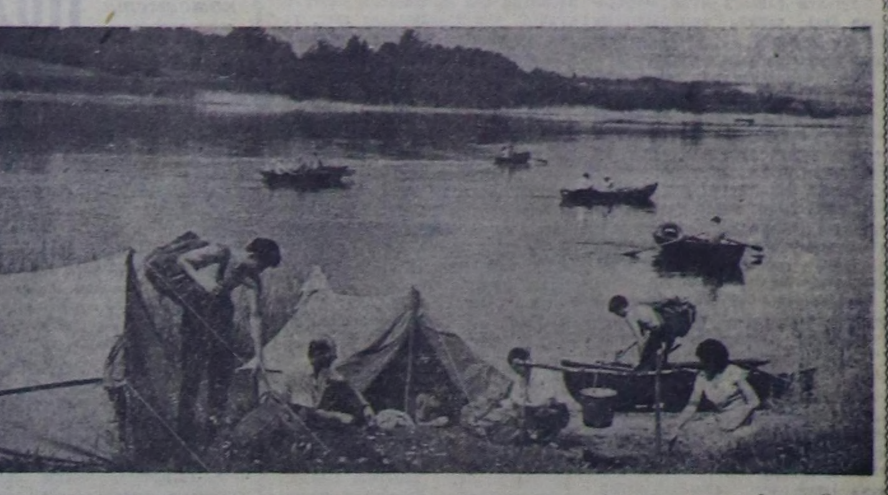
КАЛИНИН ОБЛАСТЬ. Сугу хөлөзөңнү чурталдыг черин чүрттүп бугу булуңкарында болгаш дышкыдан келген мүйүч кижилерин дыштангырынга мыак чер болдука мыак кижилер турбизини «эртимез» кобилгашы Селигер деп адал турар. Селигерге аки дыштангы, күштү немеп алгынык аргалар хэй. Ачаа автомобильлер, чаба-тергешилер, суг-мотор спортника мыак кижилер, чадаг туристер магерлерин тургузуп ап болур. Кижилер, катерлер, теллохондар, хэй-бүрү хөвирлерин хемелери ол чораш хөлдө чоруп турар. Ол хөлдө оң талазында байлак аргамыш бар.