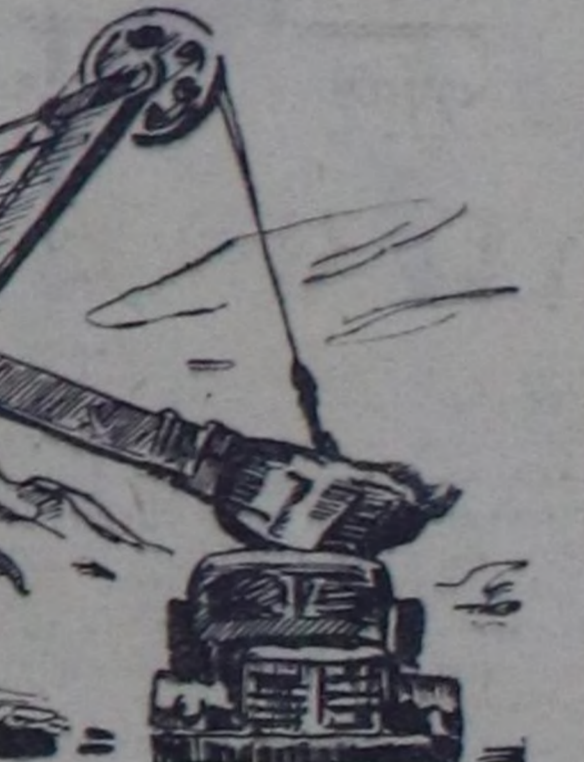
ЧУРУНТА: Бет... белдири

амыгалага кириринге сай белет-кели. чайнаанын, уруглар садынын бажынарнын туудуу турарлар. Маңаа мөөн сонгар чуртталгага херектиг бугу-ле чүүлдерни кылган туур.