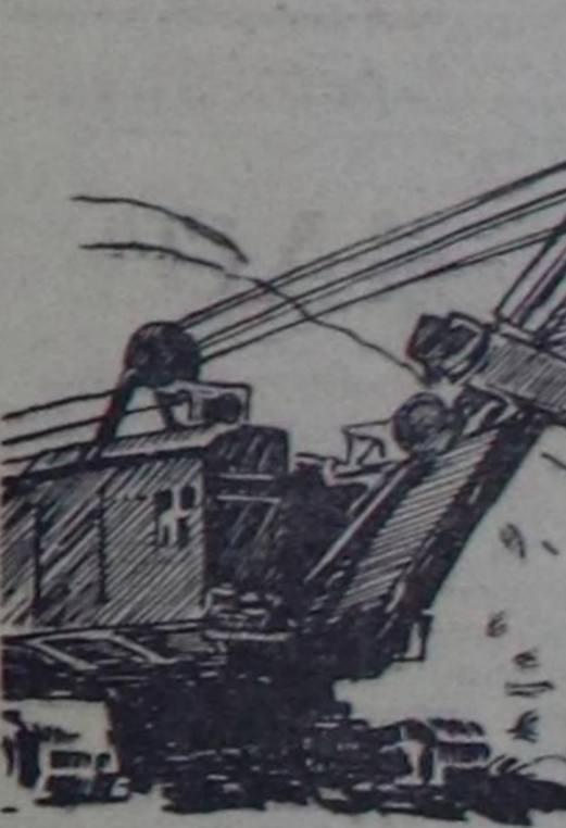
ЧУРУНТА: Бет... белдири

бызаачыларнын бригадири. Ол боаунун кылыр амылынга мергежон болгаш туудуг эртеминге ынак. Шырып мурнунда «Тыва