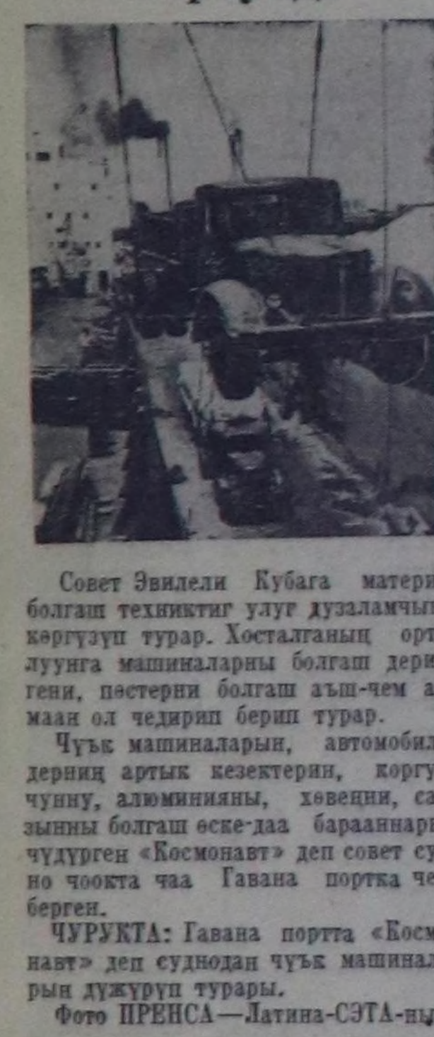
Совет Эвилели Кубага материал болгаш техникти улуг дузалачынын көргүзүп турар. Хосталганын ортулууа машиналары болгаш дерлетиңи, пестери болгаш аш-чем аймаан ол чедир берип турар. Чүве машиналары, автомобильдериниң артык кезектери, коргулчуңу, алюминияны, хөвөңни, саазыны болгаш өске-даа барааннарың чүдүргөн «Комсомолец» деп совет судно чокта чаа Гавана портага чөдө берген. ЧУРУНТА: Гавана порта «Комсомолец» деп суднодан чүве машиналарың дүжүрүп турары.