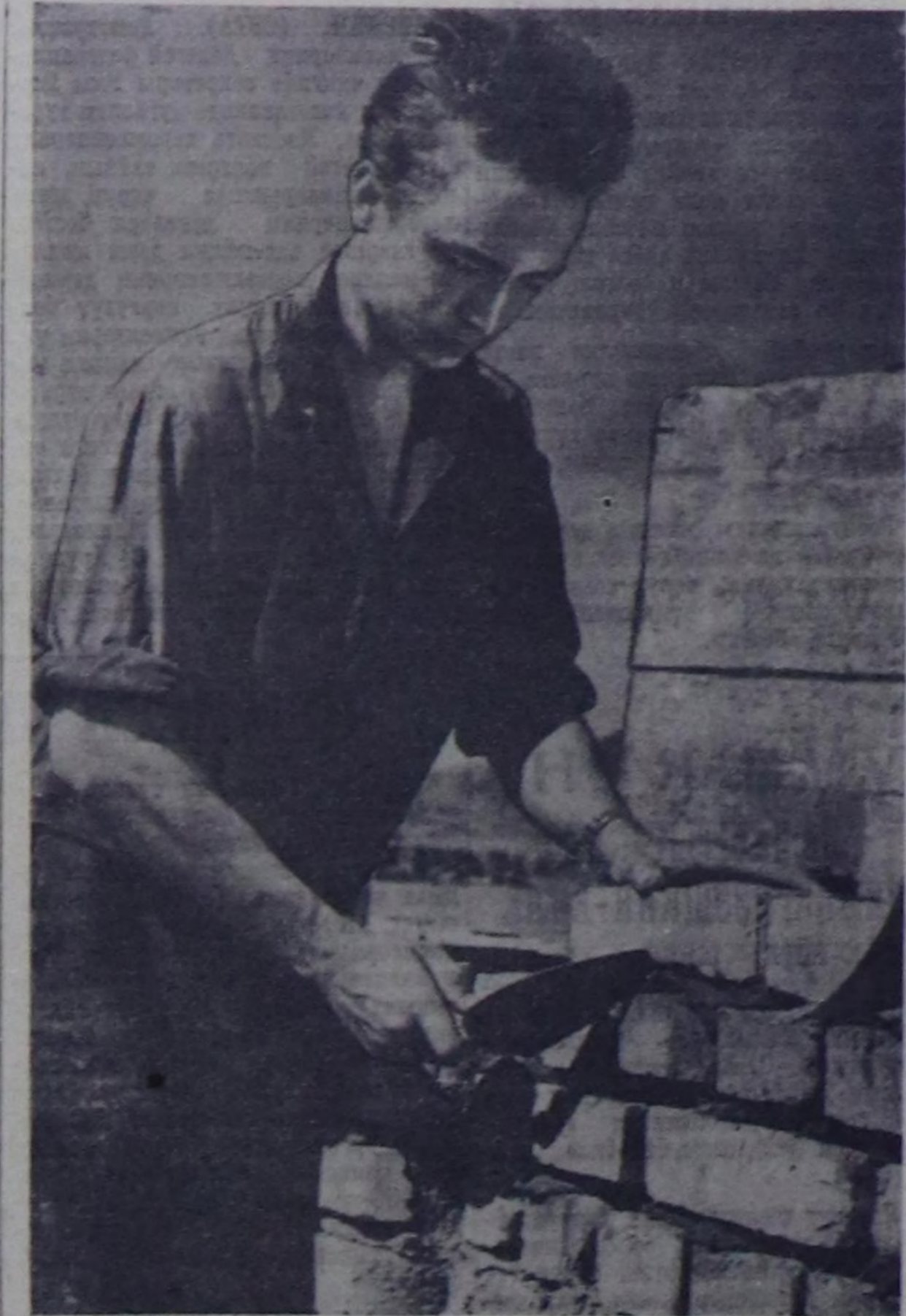
Ан-Довуранта даг-дүгү номбинанын тудуу турары-биле кады ынаа чуртталаг хоорайнын тууары үнүвү-биле чоруп турар. Ол хоорайнын бажыныкы уш-дөт ныз болгулар, школар, эмнелге хоорайныгажы-даа анаа бар болур.

«Күш-ажылдык хостуу» колхозун Эйлиг-Хем чогуунда Улуг-Хемни ке-жир паромда паромик чогулдун сөөлү үедө» Шагаан-Арыг биле Эй-лиг-Хем суурну аразында хары-лаз колдуунда үзүлген. Орук тудуунга хамаарып турган бажынын көжүрүп апарганында