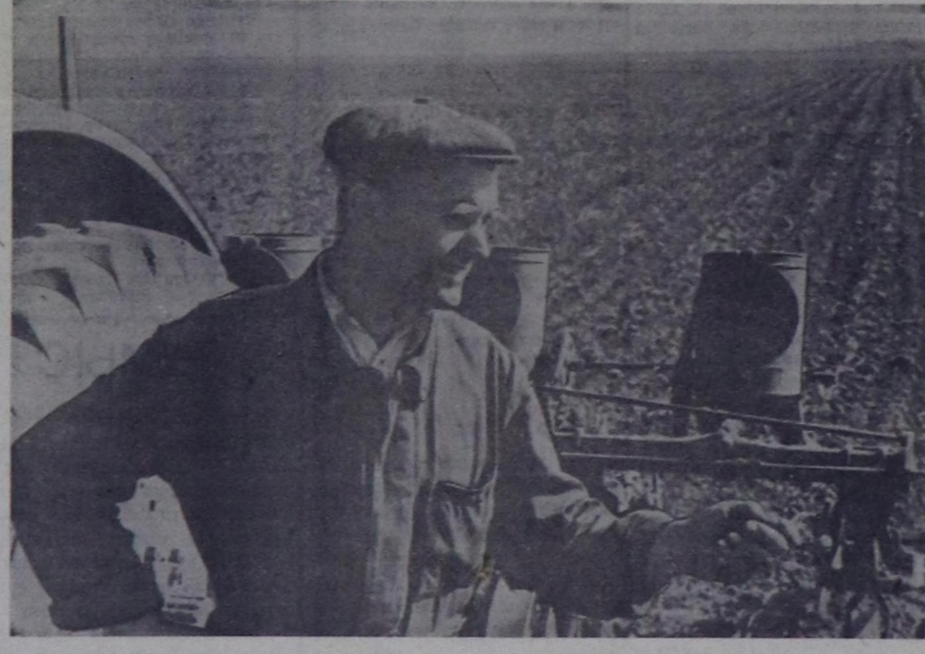
Бо чылын Миргород бугурулга өргөлдөш (Полтава область) көзө ажил-агылы ажил-ишчилери кукуру-зын гектар бургузулган 70 центер таразын дээр де-мисемип турар.

Бүгү колхозтарда болгаш совхозтарда кукурузанынч үнүжү эки, Механизаторлар тарылыгы оодурулар ара-