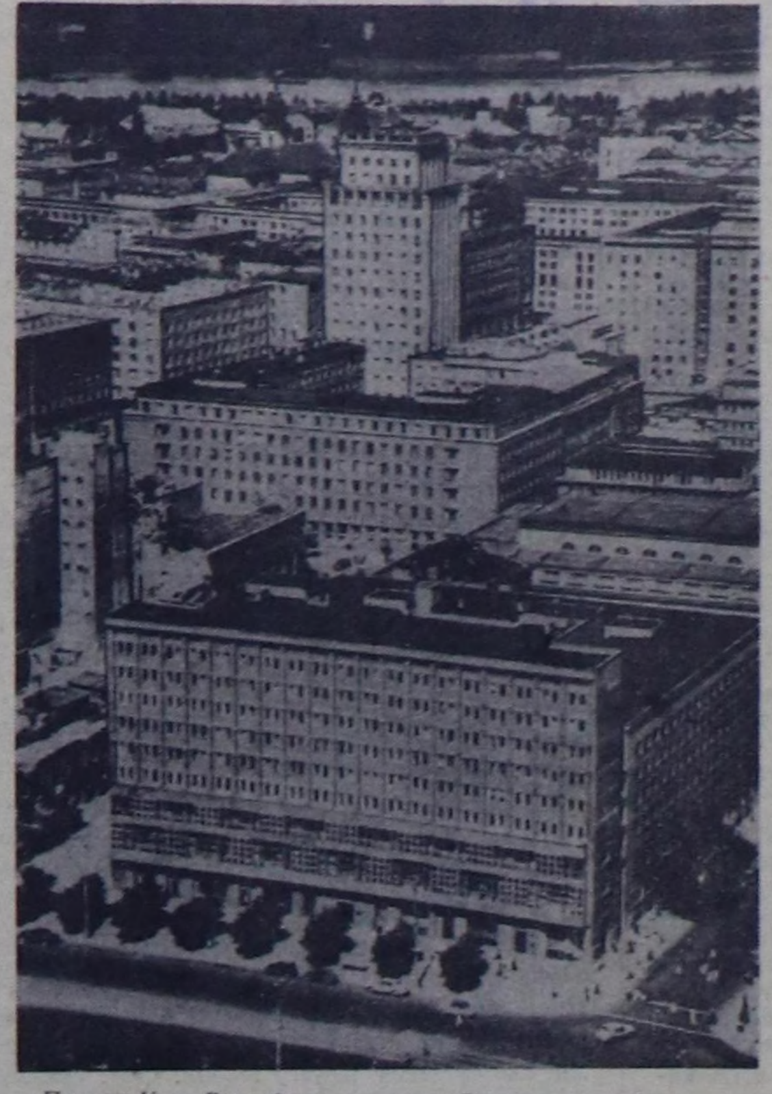
Польша Улус Республиканын төү-Варшава чыл бүрү чагаажыл орар. Ийги делегей дайынынн үезинде 85 хуузу үргөдөтүргөн Варшава бодунга таварышкан когаралды чүгө дүлпэн алган эвес, харын оон-даа артык чараш кылдыр окуп сайзырган.