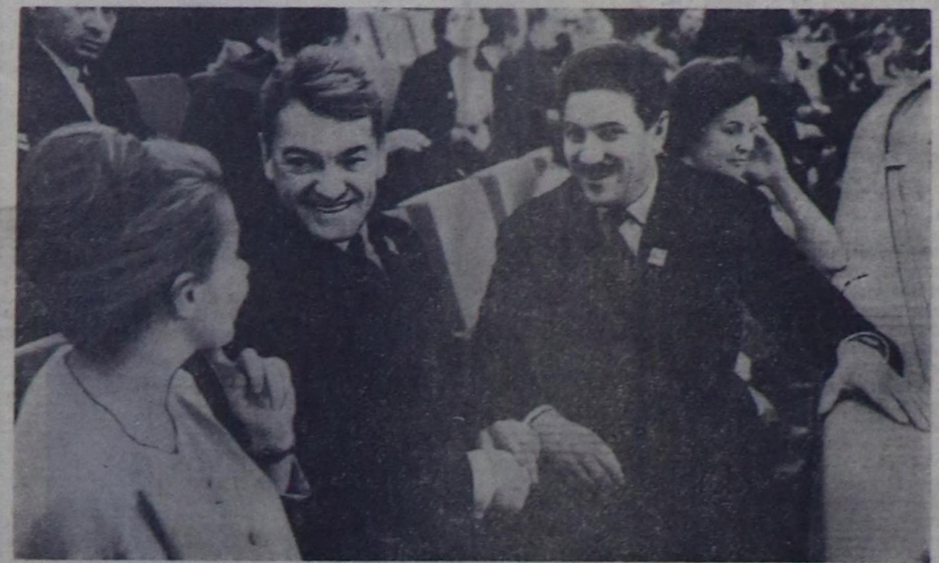
Кремлидиз Советдлер ордунда делегация III Москва кино-фестивалы. Чуртка: совет режиссер, жюридин даргазы Григорий Чухрай биле суралгы француз актёр, жюридин кезигуну Жан Морге.

Төгүлүг чеди чыл планынын бешки чылын бирги чарты доозулган. Коммунал ажыл-агый Министрствонун бөдүрүлгелери чыл планын хуусаа бетине куусадар дээр, бар четпестерин дүрген чаладын, партиязы Программында байырдалды-биле чарлаатканын «БУГУ-ЛЕ ЧҮВЕ-НИ КИЖИГЕ, КИЖИНИН ЧААГАЙ ЧОРУУНГА» деп принциптин амдыралга боттандырычыне бүгү күжүн, аргаларын болгаш курал-выларын угландырап ужурауглар.