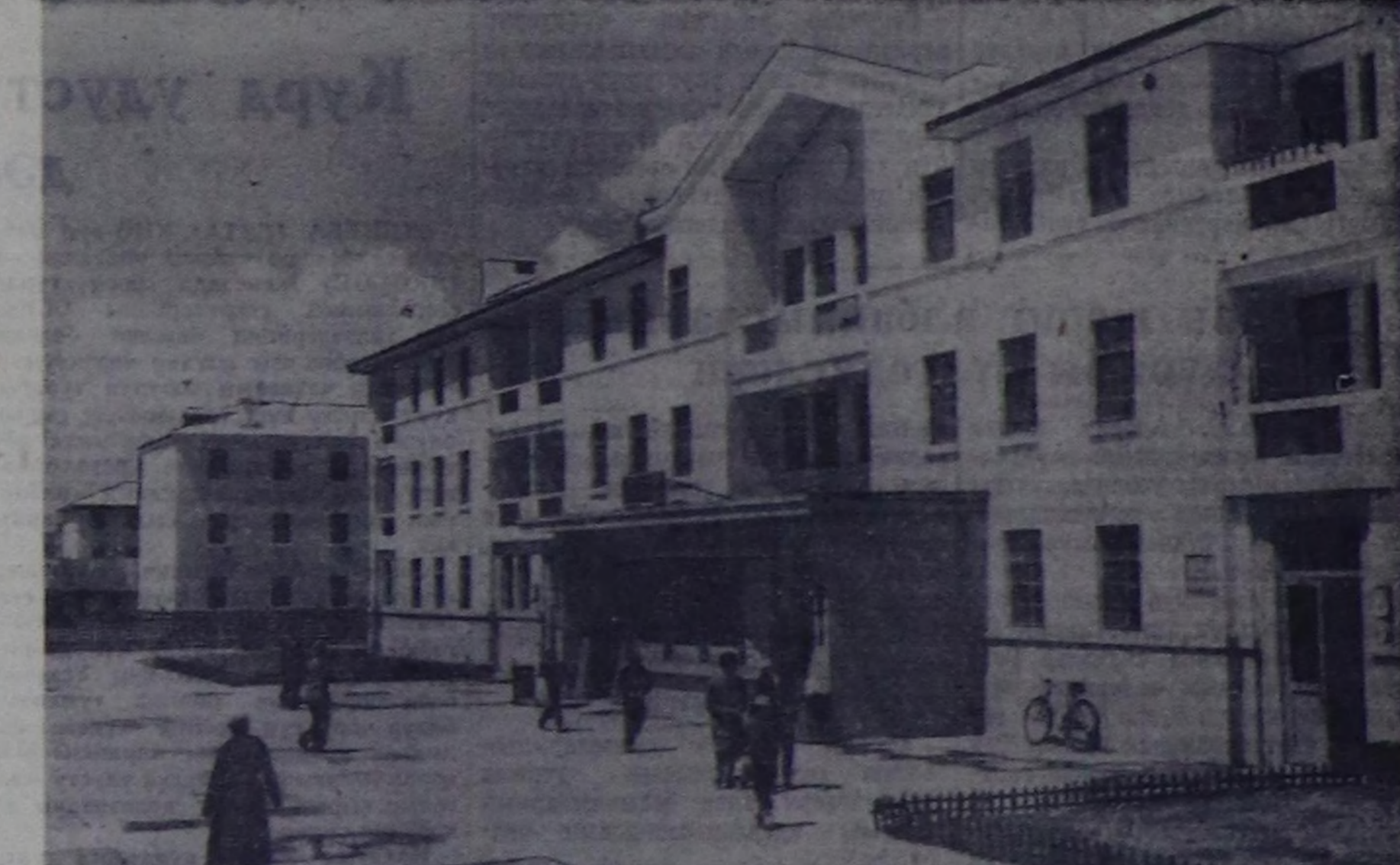
МОЛ АРАТ РЕСПУБЛИКА. Улан-Баторда Чойбалсан аттыг үлетпур комбинатынын амылданчыларынын чуртталга бажыңынары.

Тудугчулар хүнүңге уткуштур Нармынның тудугчулары күш-ажылга улам сорук кирип, боттары бедиктен социалисттик хүрээлелерин алгаш, оон-даа улуг чедикшинер дээш күженишкенин ажылдап турар. К. ЧАМЗРЫН.