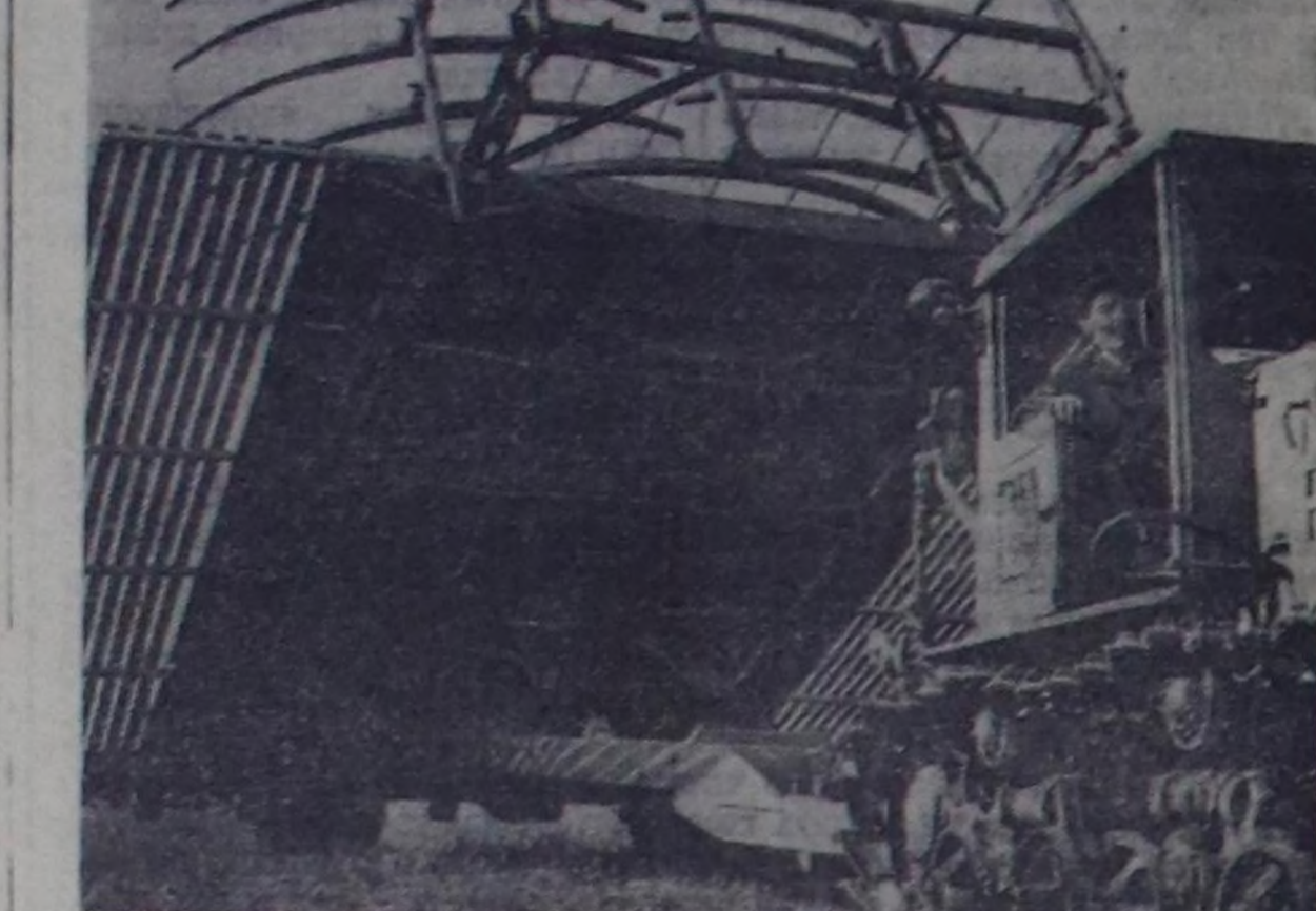
КУЙЫШЕВ ОБЛАСТЬ. Поволженин мурунунун зона айы-биле машина шензиринин станциянын шолдер

С. ЧҮЛДҮМ, Барыш-Хемчик районда «Төлий» совхозтун Бай-Тал садбарынын хойжузу.