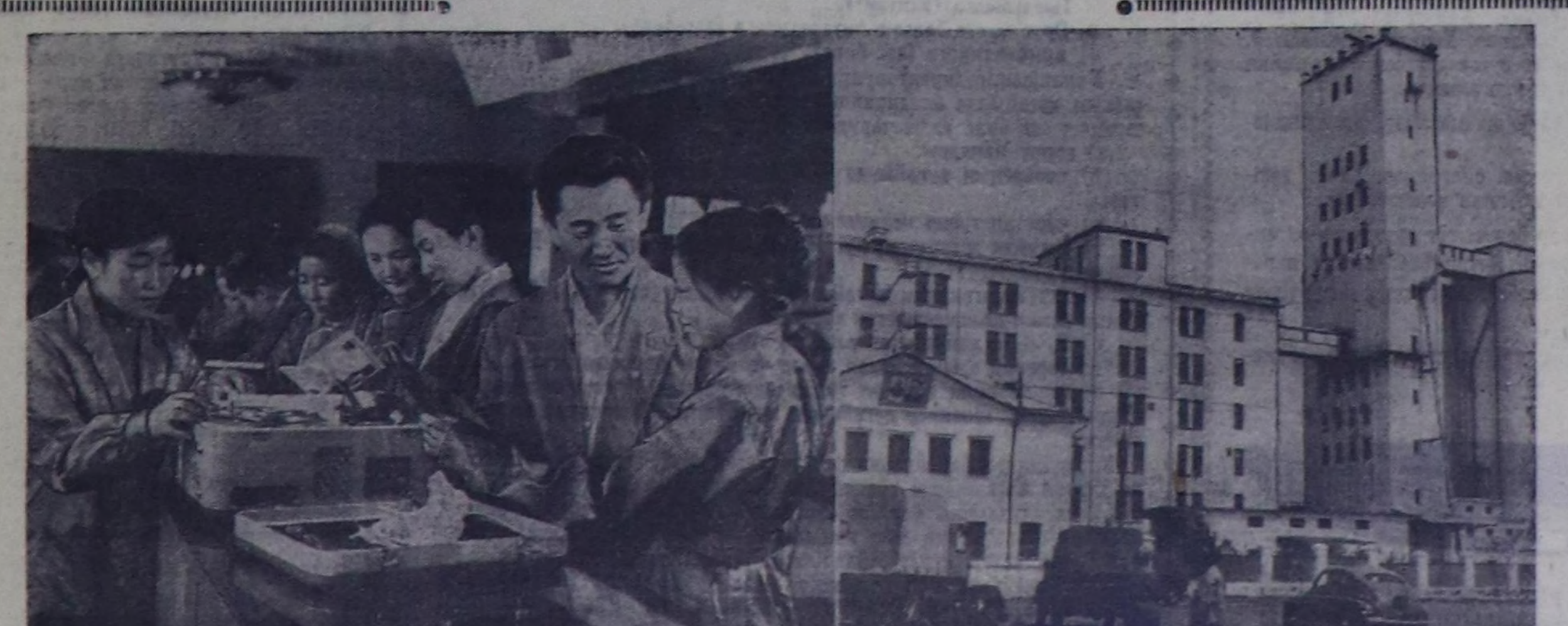
Моол Арат Республикада ажилчы чоннарын материалдыг чаагай байдалыңды деннели соксал чокка бедиң, оларын сажың алыр аргазы өздү турар.

Автомобиль транспортуңдан аңгыда демир орук болгаш агаар транспорту шакмын дөгжүп турар.