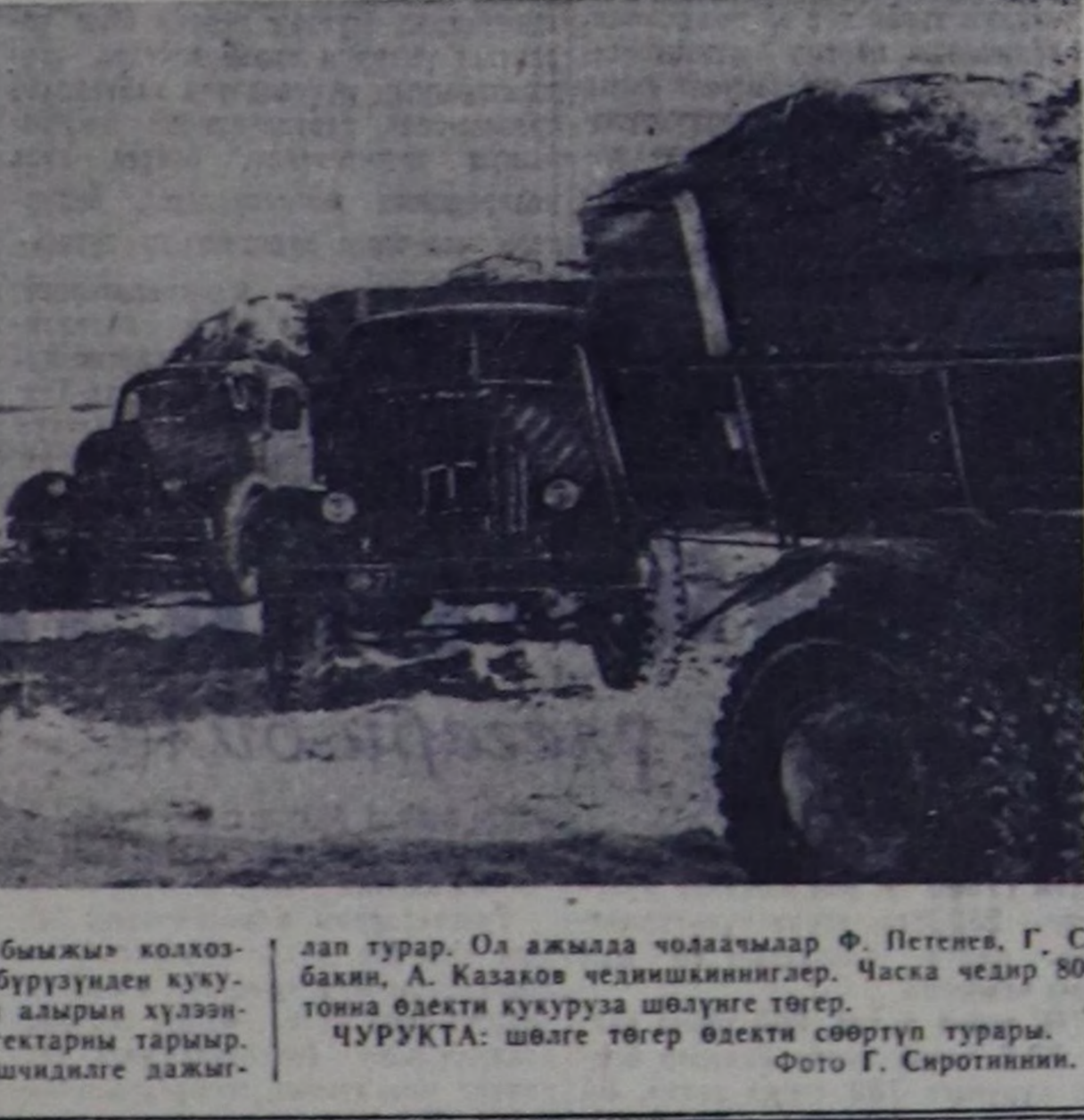
Танды районда «Революциянын чалбымы» колхоз-тун кукурузачылары бо чылдын гектар бүрүздүн куку-рузанын 300 центнер ногаан массаны алдырн хүлээ-лгени. Ол үнелиг культураны анда 400 гектарын тары-ыр. Ам кукуруза тарыыр шөлдөрдө чешиндилде дажы-лап турар. Ол ажылада чоодаачылар Ф. Петенс, Г. Со-бакан, А. Казакос чедимшиктелер. Часка чедир 8000 тонна өдөкти кукуруза шөлдүг төгөр. ЧУРУКТА: шөлгө төгөр өдөкти сөөртүп турарын.