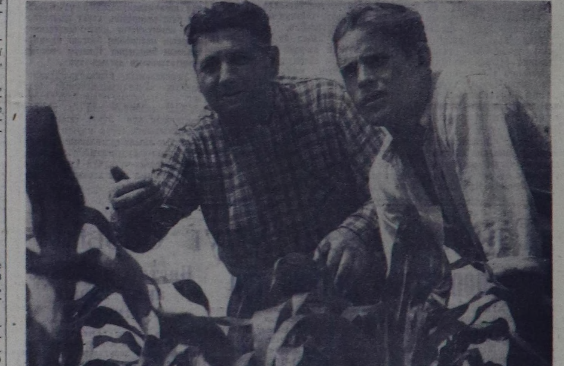
ВИТЕБСК ОБЛАСТЬ. Браславский будурдуге эргеленин «Маяк» колхозунда бо чылын тараалар, чигир сөйлөм, картофель болгаш еске-даа культуралар чаалааштыр чуртталгачы чонун кужун база калбаа-биле организастаары чугула бооп турар.