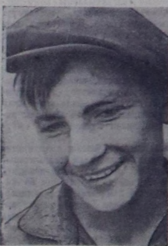
Төрөн чуртка 442,6 муң пуд тарааны бээр бис, коммунист инициатива тургузарыга бистин бо чылгы күш-ажылчы салышыкымыс ол болуун — деп, бистин «Революцияның чалбыжы» колхозтун агроному