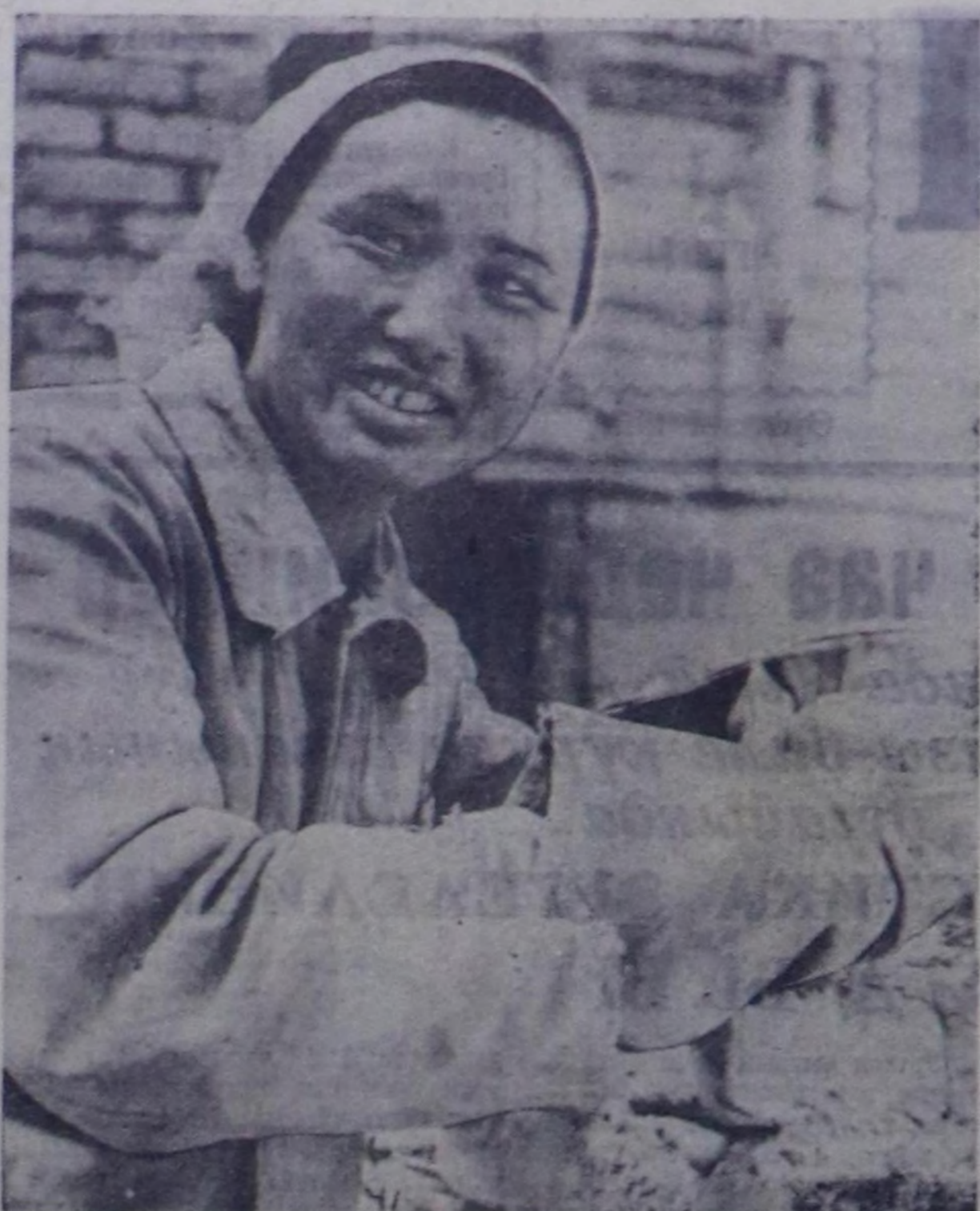
Амык кыс КАРА-САЛ Олуштан Ак-Доурактын тудууча беш чыл амыкдал...