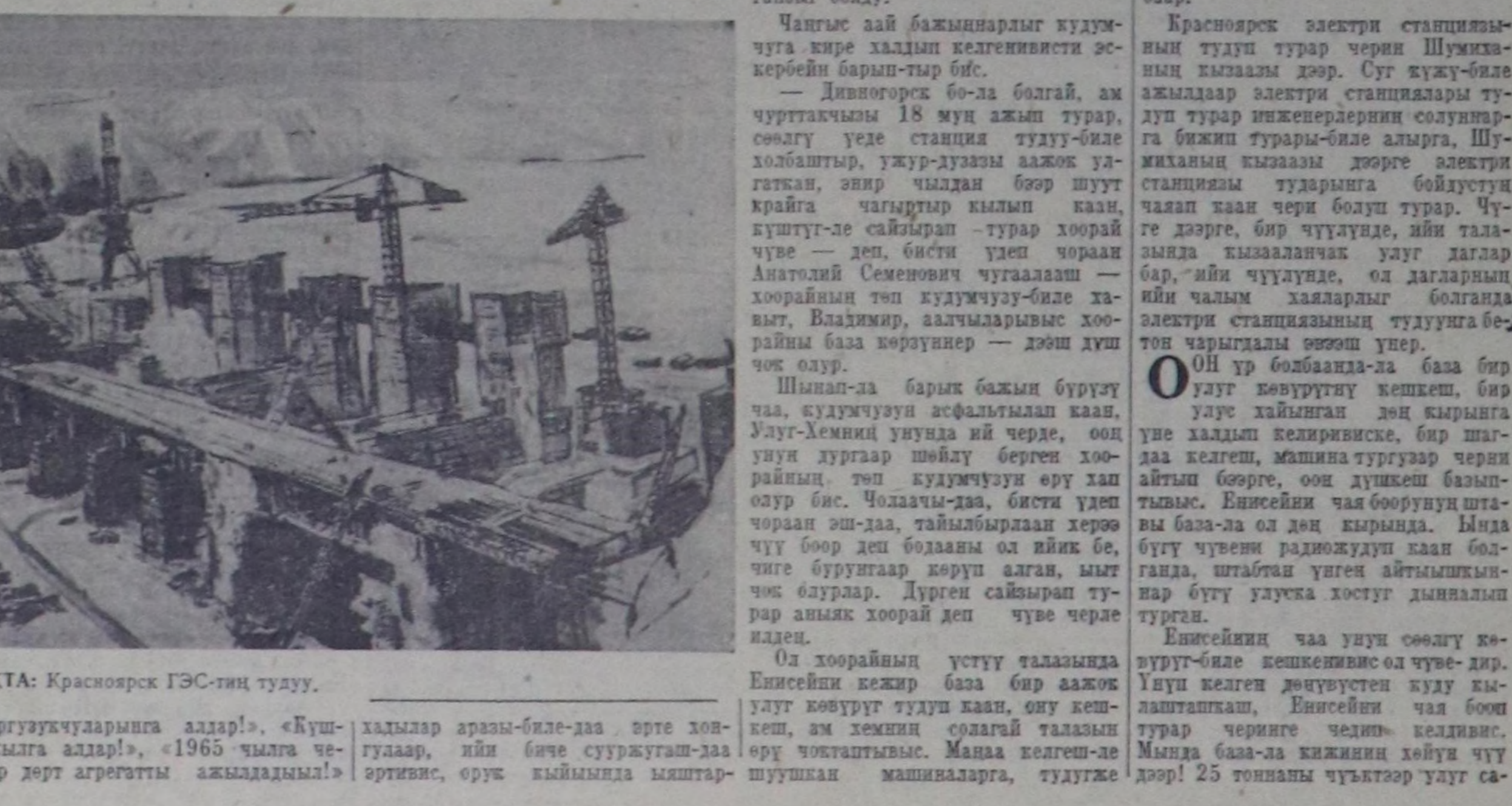
ЧУРУКТА: Красноярск ГЭС-тин тууду.

кылгаш, улук плакаттар асмылап каан, мыда Владимир Ильичиниң чуртары, «Март 25 Енисейни чажыргарынын хүнү», «Коммунизмниң дөш оон-даа өске сөрүк кирипчи кыйгырлар дыка хөй. Ол өрүк-биле хал олура, чамдыкта биче ээничгештер — аразы-биле-даа, чаа