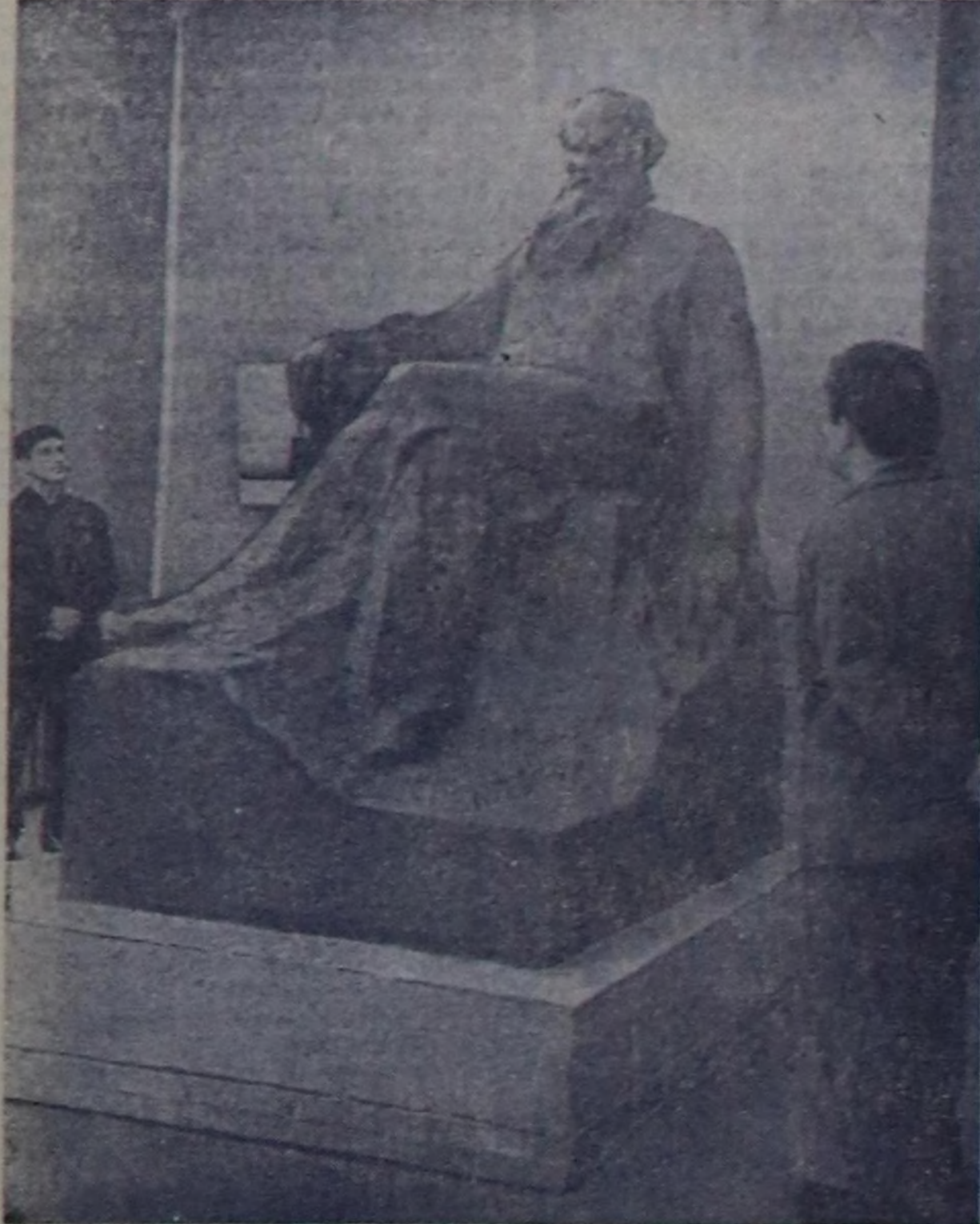
МОСКВА. Улуг орус чогаалчы Лев Николаевич Толстойга тураскаалдык моделдериниң делегегеи чуртукчулар Эвильелиң делегезе залында ажиттыккан Наймылалың болгаш Совет Эвильелиң өске-даа хоорайларында скульпторлары ол моделдерин конкурсука кириген.

Дык хөй төмөшкөлдөрдөр үш чогаалдарын шууг үш шиттирлээр-биле шилип алаат.