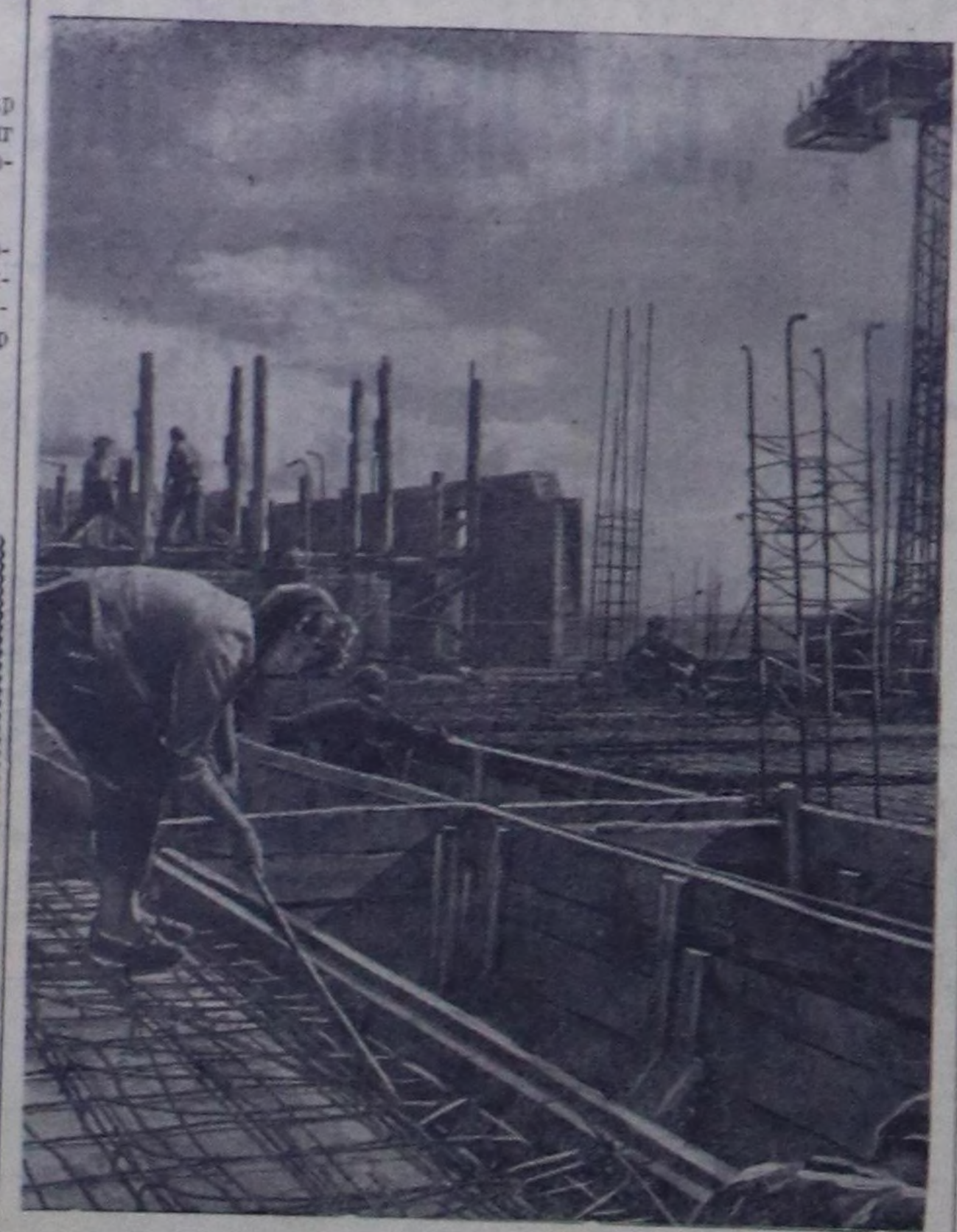
Тыванын аар үлетпүрүнү баштайгы «Тыва даг-дугу» комбинат шалкыны темплер-биле тургустунуп турар. Үлетпүр бугурулгелерин, культура албан черлерин, чурталганын чаа тудуларын ам каш-ла чыдар буртунар экинчигей чыткан черлерде тургустунгала.

олар совохозтун өскө салбырларын-дан келген тарааларын база-ла хү-лөп ап, арылгап, сорттал, курдап, ажыл норманын бүдүн чартык, ийи чедир күүсөдү турарар.