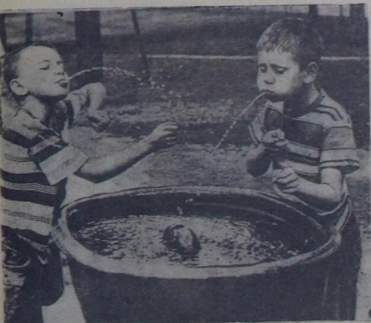
Уран-чурулаа фотографизинин Москва делегей делгелгези. Карр Рональдын (Кавказ). «ПФ-Ф-У...»