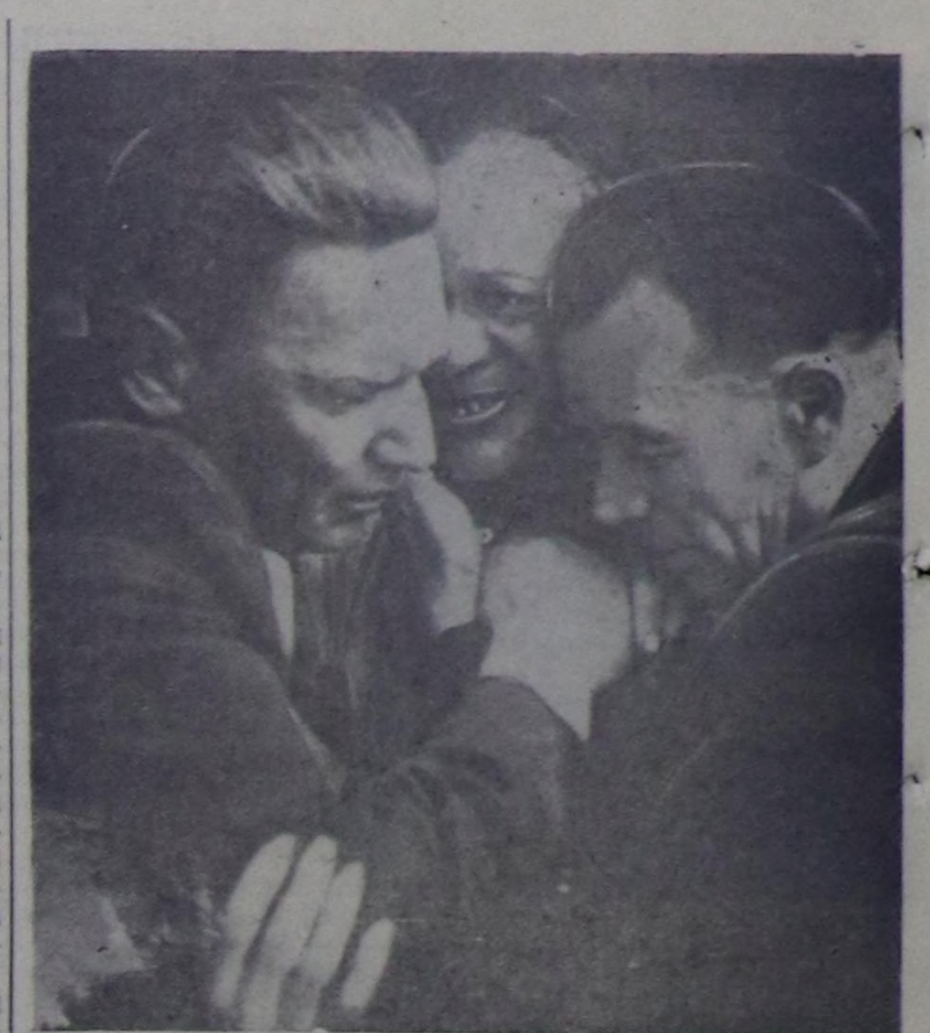
Уран-Чечен фотографинин Москвада делегей делегалгези. М. Ганкин (ССРЭ): «Он беш чыл эрткенде Брестин мадырлары».

баша салып ап болур. Стоцун сонгандан солагай талазынга олуруп ал. Кезжөк кичээлдерин кылырынга таарышкан, стол кырынын абажурун даштап амыр болгаш тур. Бажынга кичээлден турарын үезинде 45 минута болгаш-ла 10—15 минута часпарлап ап турарын утпа, ол өйдө олурган өрээли иштин агаарладып ап тур. Хой-интичти даалгаларын күсүдөрде харысалгалыг болгаш быжырчылалыг бол. Хүнүнү-не агаарлап ап тур. Эргезин ээлчегде өөренип турар болуунда дүштөк чөп чигеш, а бир эвес дүш соонда ээлчегде өөренип турар болуунда эргезин чемин чип алгаш, агаарлап ап турар керек. Ындыг селгүстөшкенин үезинде күш-култураны кылып, азын-бүрү шимченгир ооннарга киржин ойнаар керек. Дыштеринин аштап ап, удуур муруну чарында чунарын болгаш буттарын чуп ап турарын кажан-даа утпа. Идик хейи ары-силги эдиле! Улуг кижилерин хүндөлүп, бичин думалары дорамчылавай чор. Пионерлер болгаш школачылар! Кызыл Крест иштиндеги кирип алынар! Санитарыг билгелерин шигээлдип алынар! ТЫВА ОБЛАСТЫН САНИТАР-ЧЫРЫДЫШКЫН БАЖЫНЫ.