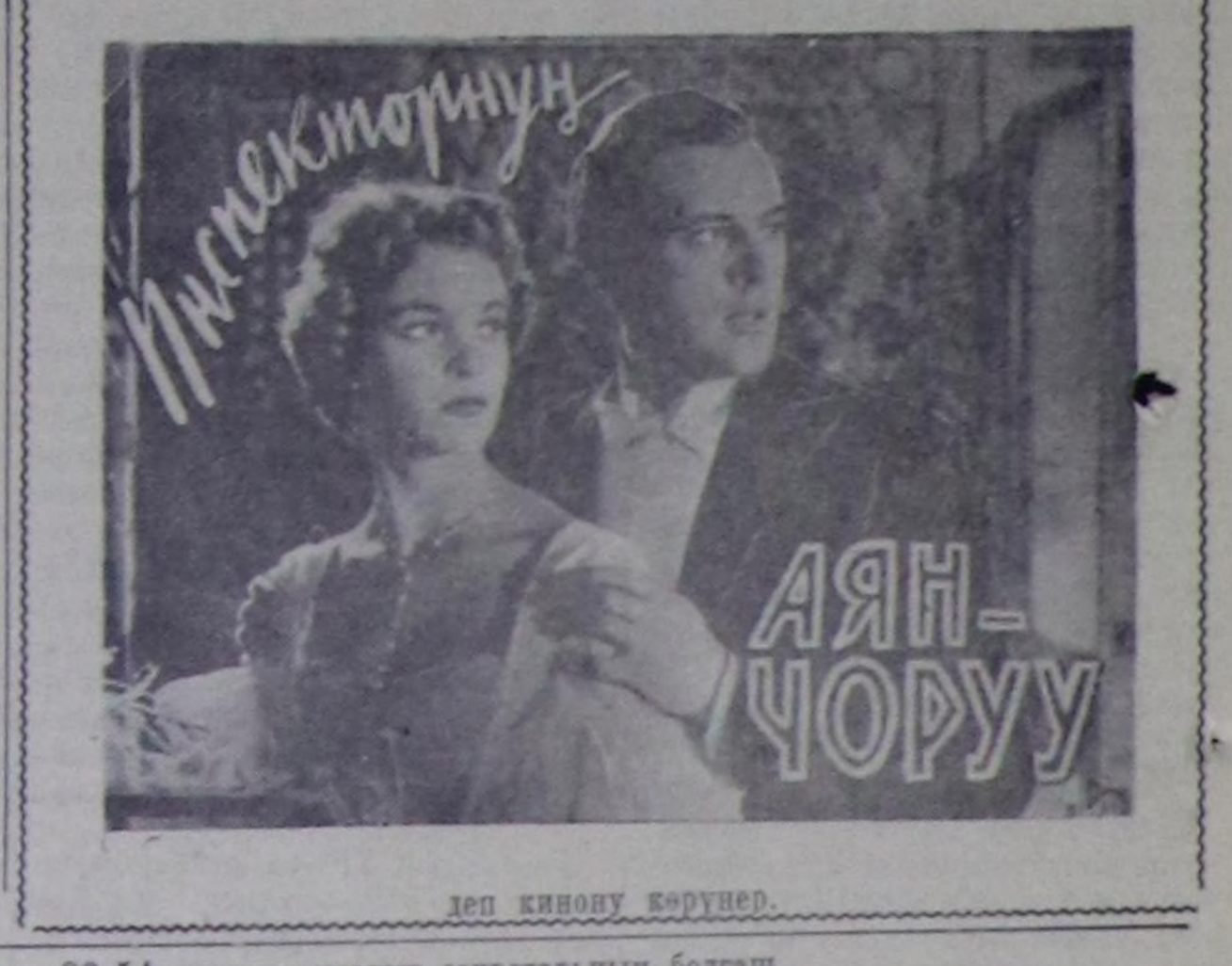
деп кинолу буртвед.

РЕДАКЦИЯНЫН АДРЕЗИ: Кызыл, Шетинкин кудумчуу, бажын № 3 ТЕЛЕФОННАРЫ: редакторун 24-63, редакторун оралакчынын 35-24, пропаганда килдизинин 23-54, харысалгалы секретарынын болгаш харысалгалы дежурнынын 23-35, көдө ажил-агый килдизинин 25-38, партийн амырлар болгаш култура амырлар килдизтеринин 37-13, иштин информация килдизинин 20-60, чагаа болгаш совет тургузат килдизтеринин 21-27, улугтур болгаш транспорт килдизинин 22-64, бухгалтериянын 31-76, корректорларын 21-47. Солун келбей барганда 32-75 телефонче долгаар.