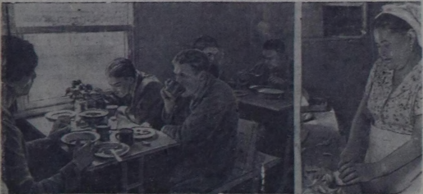
(Төмүрү, Эгеи 2—3 арыннара).

Чээ орук тууунда бүтүлө ажылдар механизацияланган. Экскаваторлар довракты усаши, самосвал машиналарынын ишкер хазыктарын чык долдуу уруула туралар. Аяда келеш экскаватор башкычынын мертеженин кайтап турдум. Экскаватор ускужун өрү көдүрүп келеш черге кадалыр шаапшы, ол-ла доран катат бедирге көдүртүшкөн ийн талаларынче долганым турда дөргө чүгө кара шокораннар болду. Долдуу чүдүртүнгөн самосваллар арай бөрдү шимчеп үгөш, чүгүн орук чалыга экеп төп туралар. (Устунде оң таланы чурум).