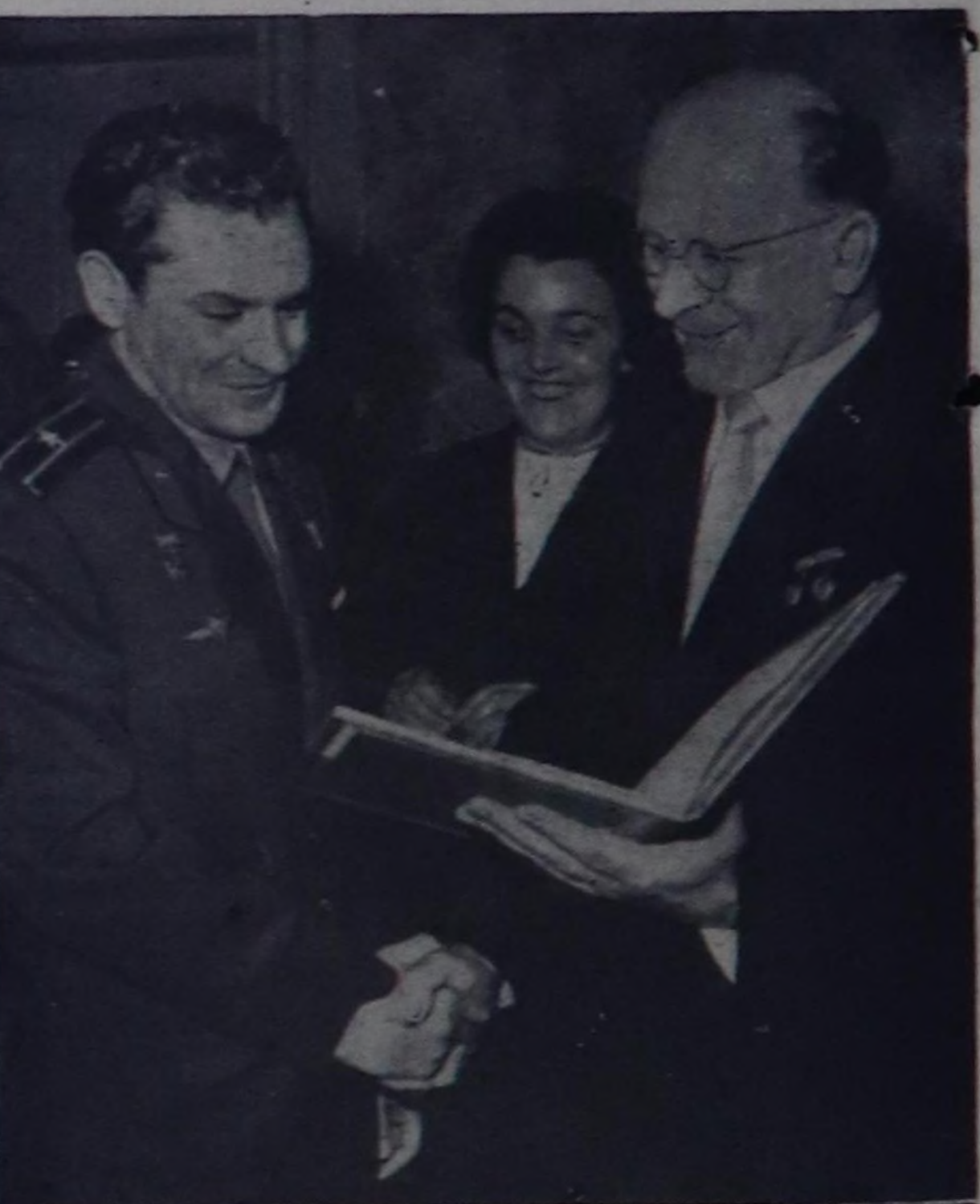
Космонавт-ужудукчу Совет Эвилелиниң Маадыры Г. Титов чоокта чаа ГДР-ге чорган. Германиянын Социалист чыгыш ай партизанын ТК-ынын Бирги секретары, ГДР-ниң Күрүнө Чөвүрелинин даргазы В. Ульбрихт эш Титовка Кара Маркс орденин тысып тур.

Улут-улут хоорайларга метропо-литенин, хөй кижя олурар автобус-тары, троллейбустарын, монорельс-тиг транспортту, албанан болгаш хууңуң херөөнү талазы-биле чыг-чыгачыс кижилерин аян-чор-уунга—таксилерин хөлөйлөп ажылаар автомобильдерин холд-дып хөгжүдөр. Ийиги он чылдын дүргүндө хоорай транспортун ажыглаары халас апаар. Самолёттар ырак чер бээр кижилерин хандылар, ортумак ырак черлерге алектриг демир орук, автомобиль транспор-тун, чөөк черлерге вертолёттарын азы дөрт дүңдүштөлип ужал, хоорайларын бажыварынын кыры-нга болгаш улут эвес шөлүгүстөри-ге конуп шыдаар самолёттарын ажыглаар апаар.