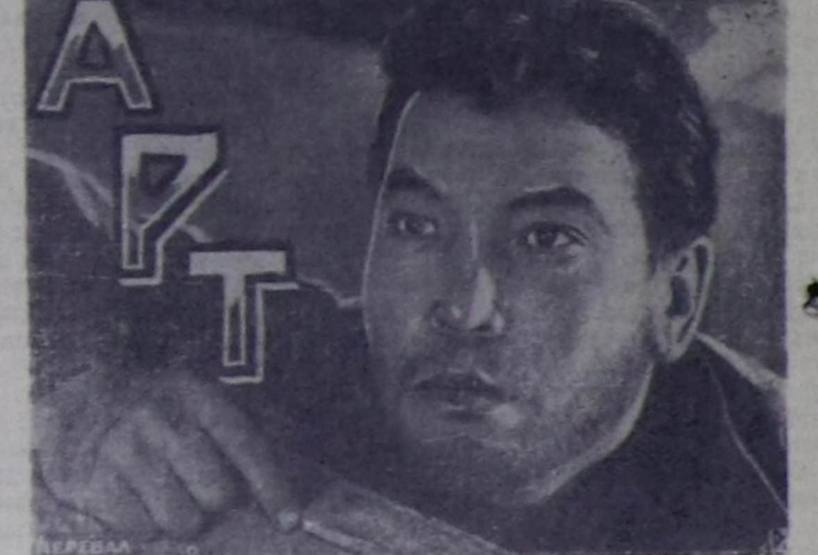
Тыва автотрестиниң начальнигин ооракчымы деп кинону көрүңер.

РЕДАКЦИЯНЫҢ АДРЕЗИ: Кызыл, Шетинкин кудумчуу, бажы № 3 ТЕЛЕФОНАРЫ: редакторун 24-63, редакторун ооракчымын 35-24, пропаганда кидизини 23-54, харымсалгалыг секретарынын болган харымсалгалыг дежурнынын 23-35, көдө ажыл-агый кидизини 25-38, партия кижи амырлар кидизини 37-13, иштиги информация кидизини 20-60, чагаа болган совет тургузук кидизини 21-27, үнелүр болган транспорт кидизини 22-64.