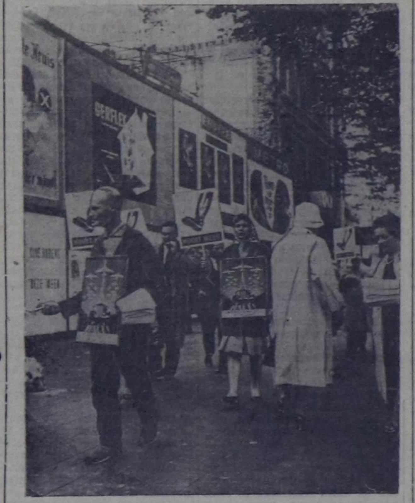
БЕЛЬГИЯ. Бельгияга барын-герман шериг базаларын тургузарына улуз чыскаал Антверпен хоррагга болган. Ук чыскаал барын-герман милитаристерге улуз өлүк-биле нудумчуларга болган. Чыскаалчылар-нын тарарып чораш хуудууларында ГДР-ни, Одер-Нейстеп чоруткан күрүне кызыгаарын хүлээп көрүп база Германия-биле тайбыңнык нер-везин чарары-биле чугааламышыкынарны дораш эгелезин негеп турар. Чурунта: чыскаал өйүндө. СЭТА-ның фотохрониказы.