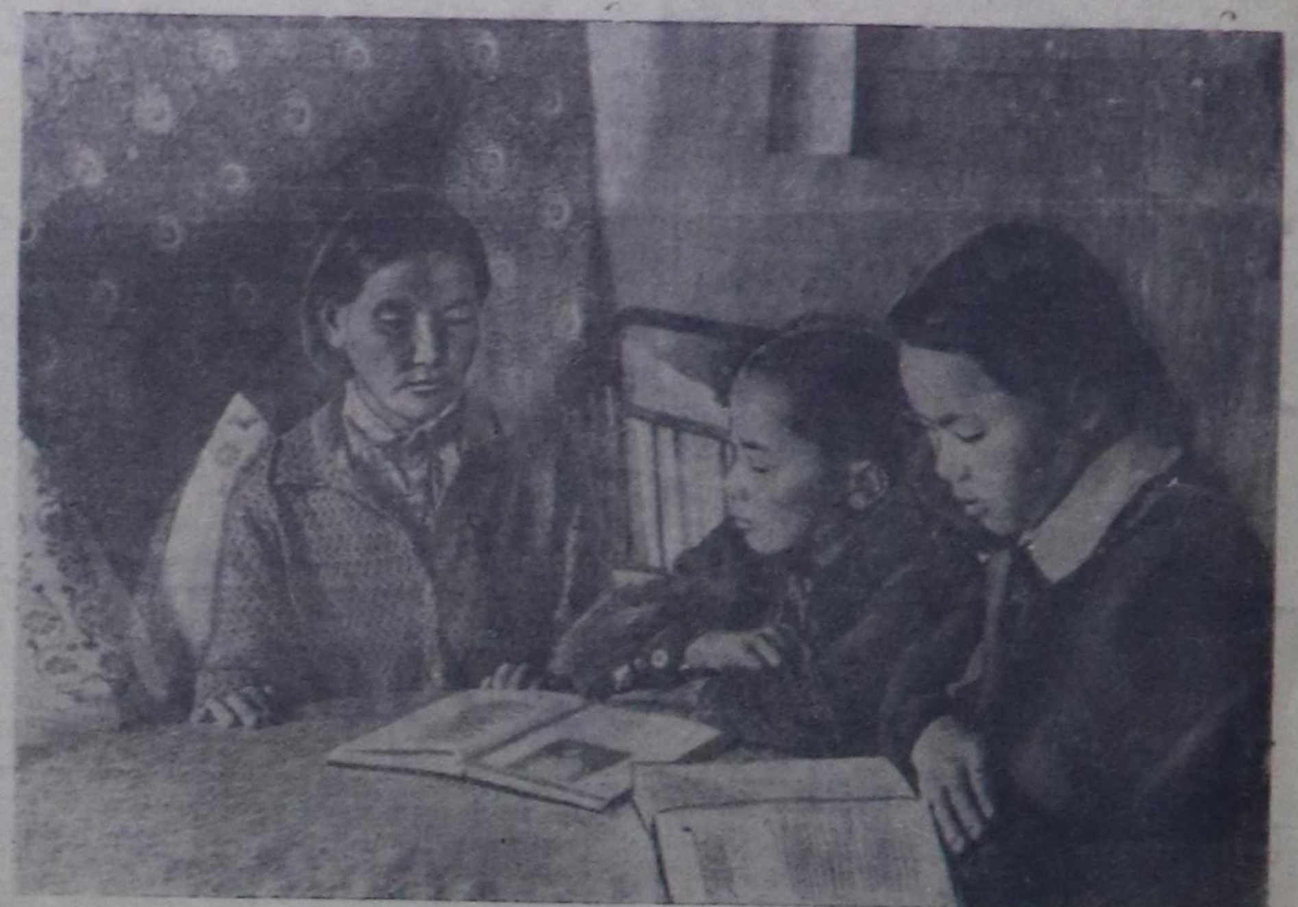
Ооржак Дембиреловна Сүрүн...