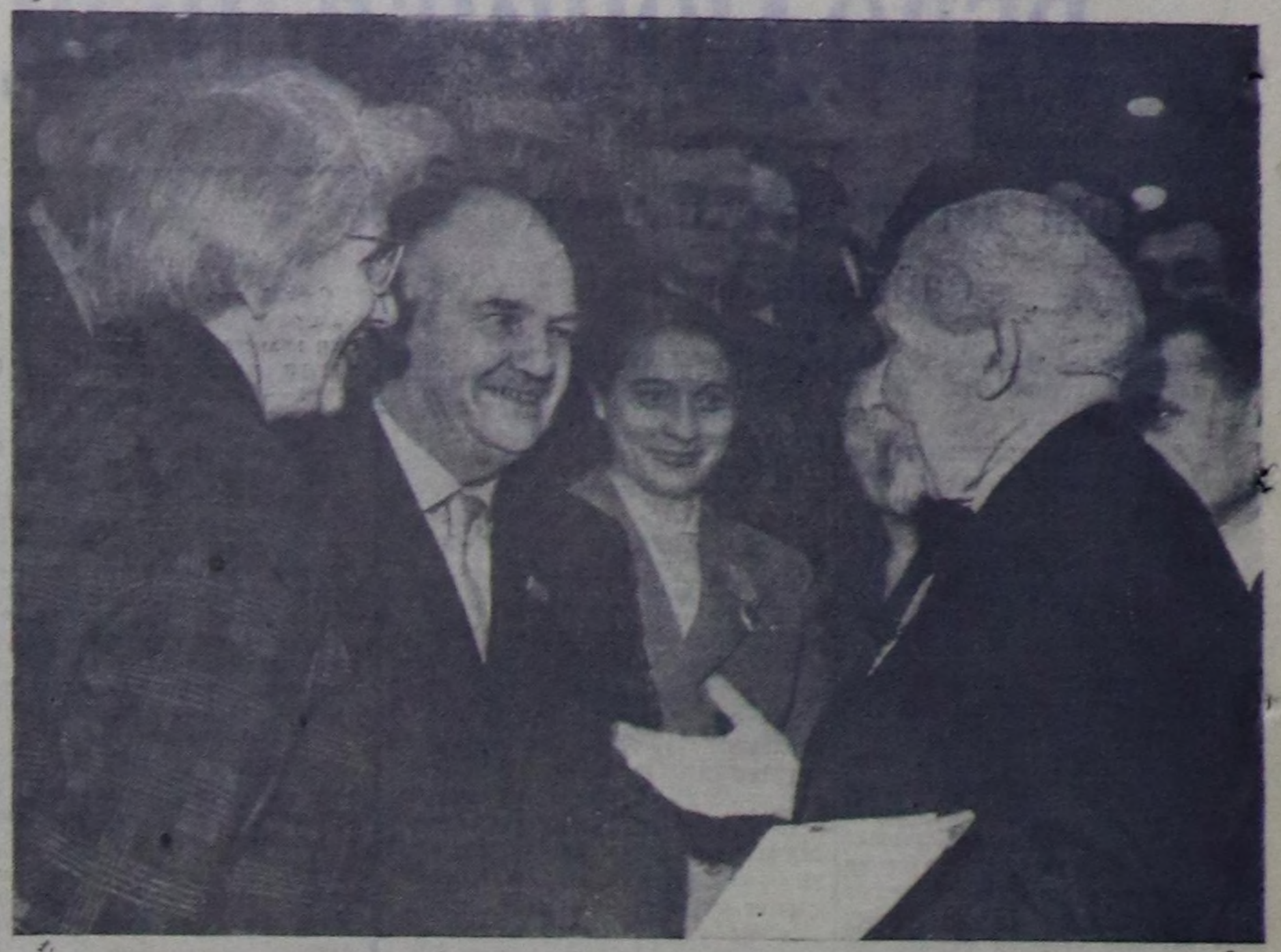
МОСКВА. Совет Эвилелинң Коммунистик партиянын XXII съезди. ЧУРУКТА: Франциянын Коммунистик партиянын чигине секретары Морис Торез болгаш ФКП ТК-ның политбюрозунуң кежигүчү Ханнетта Вермери олар Совет Эвилелинң Коммунистик партиянын 1899 чылдан бээр кежигүчү П. И. Воеводин-биле чугаалажып турлар.

РЕДАКЦИЯНЫН АДРЕЗИ: Кызыл, Шетинкин кудумчуу, бажы № 3 ТЕЛЕФОНАРЫ: редакторун 24-63, редакторун орадакчынын 35-24, пропаганда кидизинин 23-54, харысаалгалык секретарынын болгаш харысаалгалык дежурьинин 23-35, көдө ажыл-агый кидизинин 25-38, партияны амдырал болгаш культура амдырал кидизинин 37-13, иштинин формацыя ажылдын 20-60, чагаа болгаш совет тургузуу кидизинин 21-27, үлөтүр болгаш транспорт кидизинин 22-64, бухгалтериянын 31-75, корректорларын 21-47. Солун келбейн барганда 32-75 телефонче долгаар.