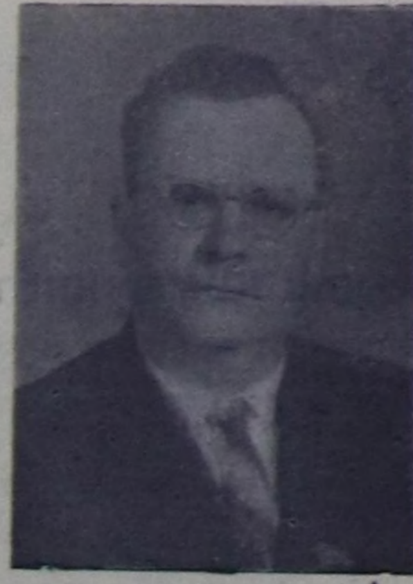
Г. И. Воронов