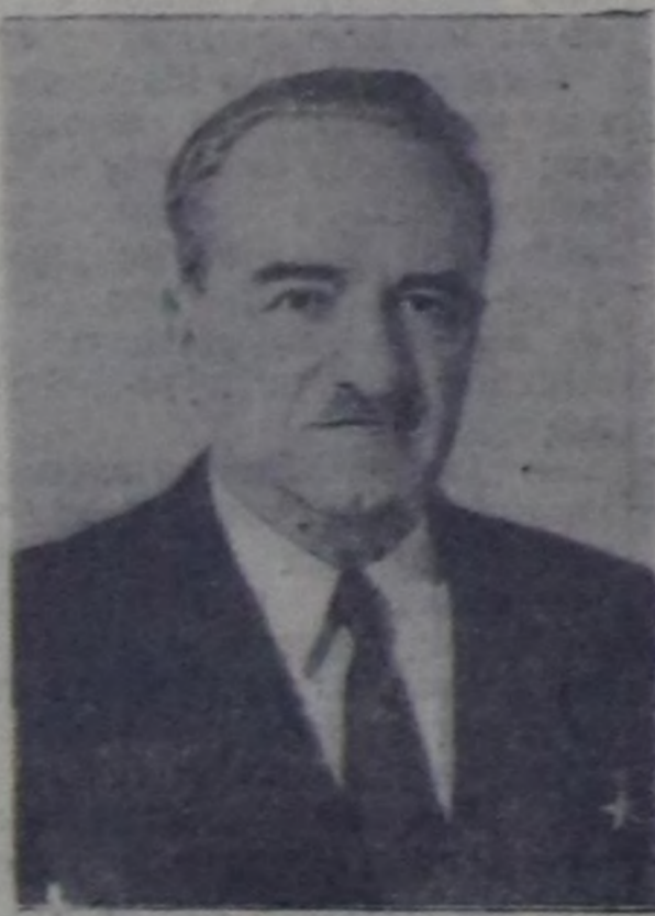
А. И. Микоян