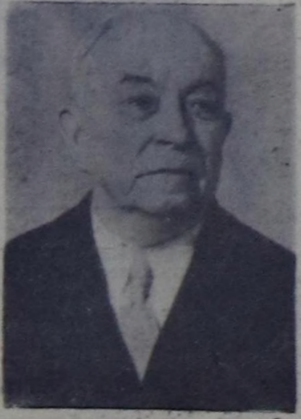
О. В. Куусинен