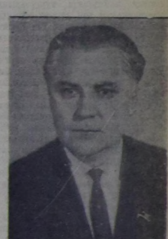
В. В. Щербицкий