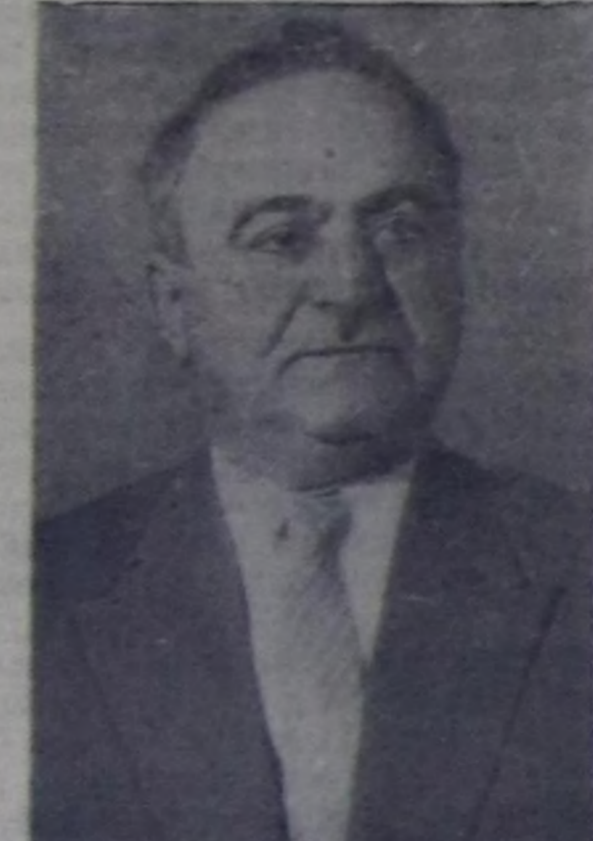
В. П. Мжаванадзе