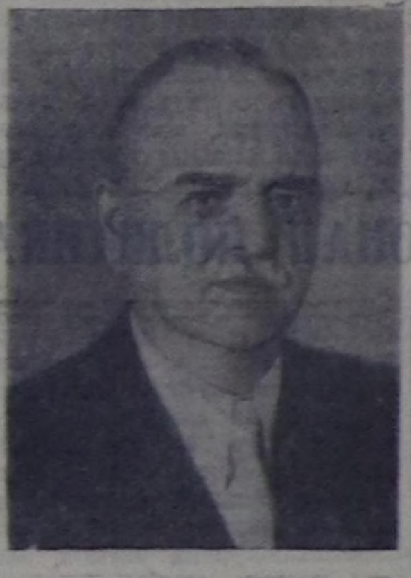
Н. М. Шверник