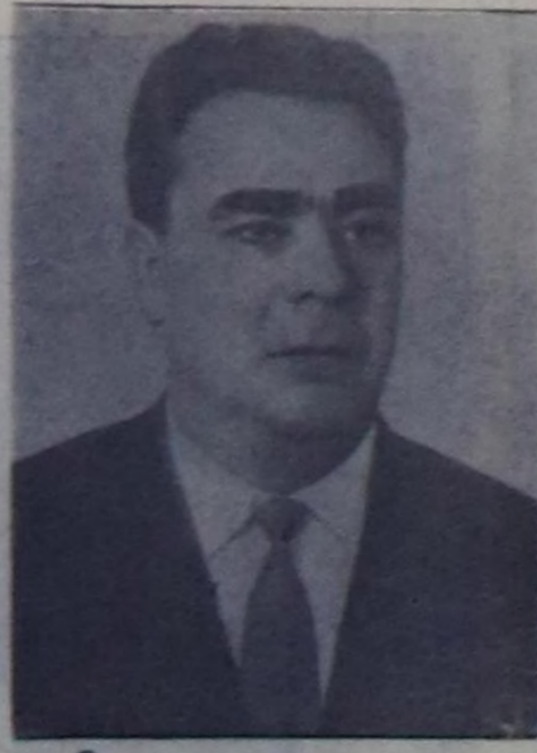
Л. И. Брежнев