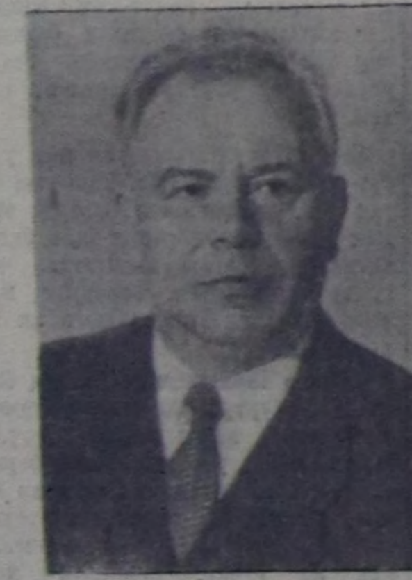
Н. В. Подгорный