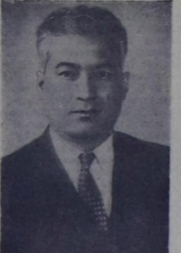
Ш. П. Рашидов