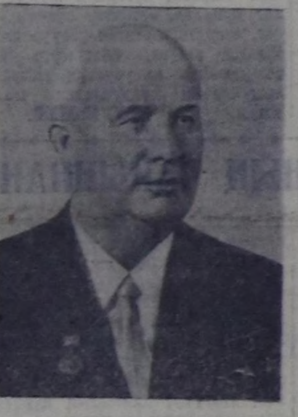
Н. С. Хрущев